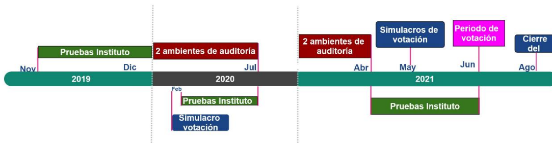
Diagrama 2: Cronograma de pruebas del Sistema de Voto Electrónico por Internet

Durante cada etapa de la implementación del Sistema de Voto Electrónico por Internet se realizarán pruebas por parte del “ Instituto ” y los entes auditores en los ambientes establecidos para tales efectos. A continuación, se presenta el cronograma de pruebas a realizar durante el periodo 2019-2021.