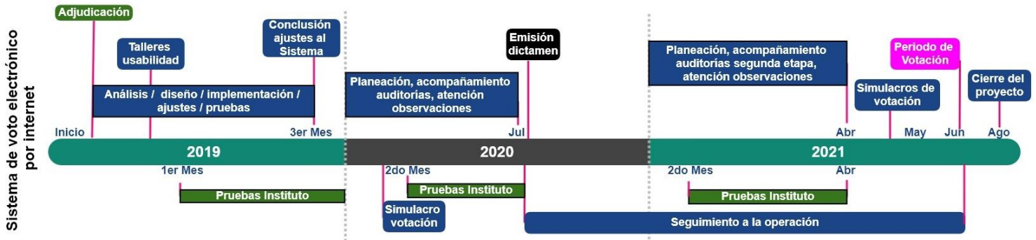
Diagrama 1: Cronograma de implementación del Sistema de Voto Electrónico por Internet

Durante cada etapa de la implementación del Sistema de Voto Electrónico por Internet se realizarán pruebas por parte del “ Instituto ” y los entes auditores en los ambientes establecidos para tales efectos. A continuación, se presenta el cronograma de pruebas a realizar durante el periodo 2019-2021.