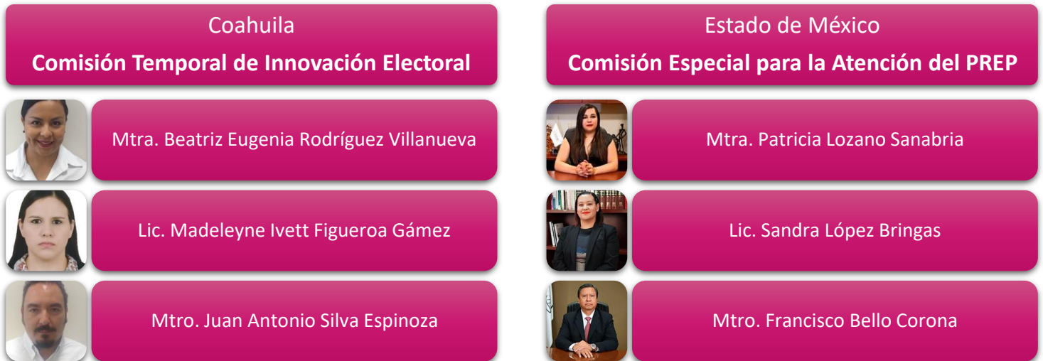
Tabla 3. Comisiones de seguimiento a los trabajos del PREP 2022-2023

que se precisan los nombres de las Comisiones integradas por los Órganos Superiores de Dirección de los OPL, así como el de las y los Consejeros del OPL que las conforman, las cuales, darán seguimiento a las actividades en materia del PREP: