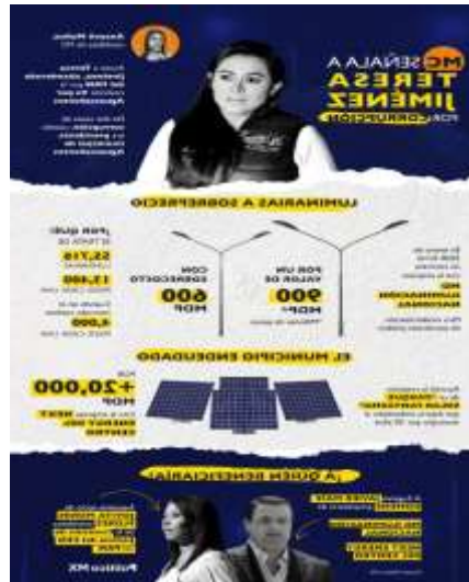
ID 6: Medio: “Perfil de Twitter Político MX”, fecha veintiuno de abril de dos mil veintidós, contenido de la publicación:

“MC señaló a @TereJimenezE por dos casos de corrupción cuando fue alcaldesa: la compra de luminarias a un sobrecosto de 600 mdp para renovar el alumbrado municipal y la creación de un “parque solar fantasma” que endeudará al municipio por más de 30 años. https://politico.mx/sl/2sW72 ”