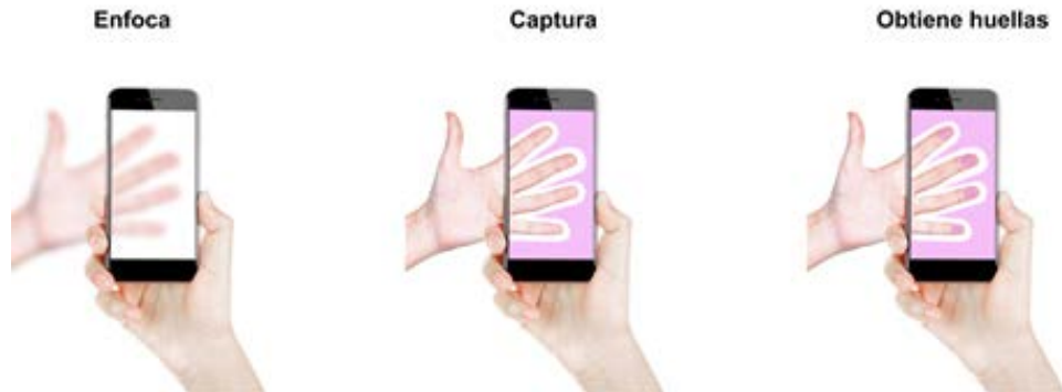
Figura 1 "Captura de Biometría Dactilar."

"El Proveedor" entregará en una memoria USB los archivos con extensión .aar para Android y .framework para iOS, los cuales corresponden al SDK de biometría dactilar. Dicha memoria USB deberá entregarse a los 5 días hábiles a partir del fallo de la adjudicación.