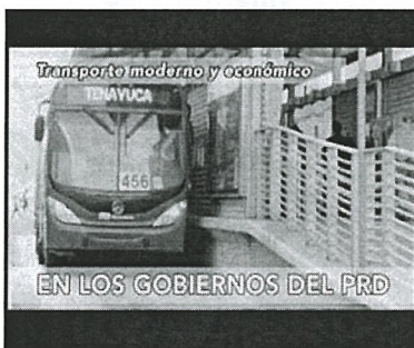
... ¡y buenísimo!