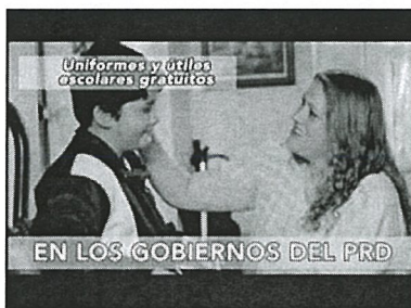
Voz de mujer: En los gobiernos del PRD sí piensan en la educación de nuestros hijos.