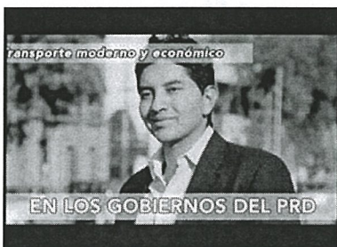
Voz de hombre: Hoy tenemos el transporte público más barato del mundo...