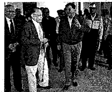
Supervisa MGZ avance de las obras de Ciudad Judicial y el Centro de las Artes 6 de abril - 2015 - 9:17 pm