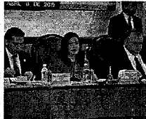
Aurora Aguilar recibe al Gobernador del Banxico y al Presidente de la CNBV 9 de abril - 2015 - 6:26 am