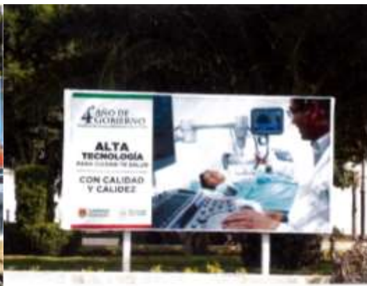
Parque Santa Isabel Xiloxoxtla