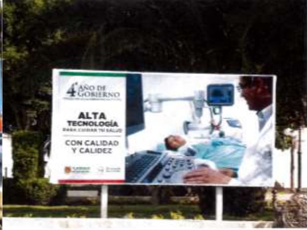
Parque Santa Isabel Xiloxotla