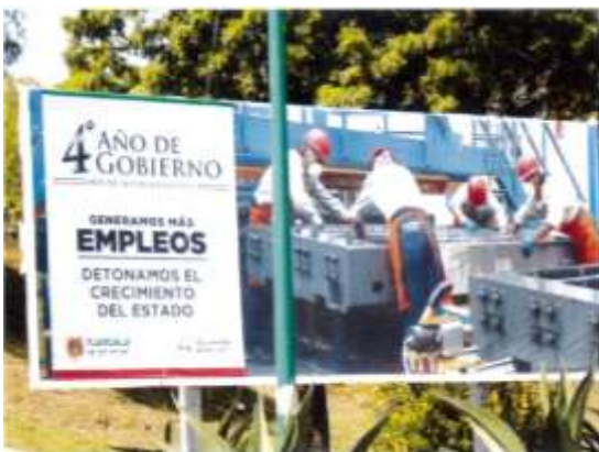
Carretera Apizaco-San Martín entrada al trébol, Tlaxcala