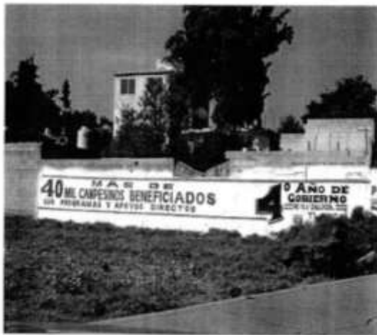
Calle Jaime Nuno enfrente al N°1, Ixtacuixtla.

PROPAGANDA EN MEDIOS IMPRESOS DEL "CUARTO INFORME DE GOBIERNO"