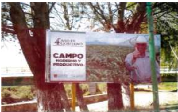
Riviera del lado del centro expositor a 50 m. del puente, Tlaxcala