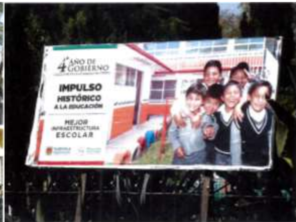
Junto “Casa Artesanías”, Tlaxcala