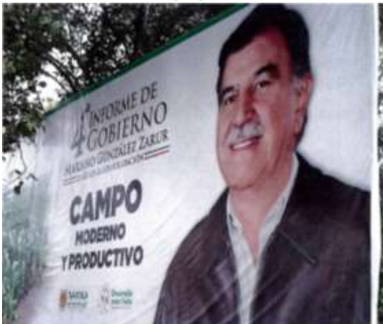
Carretera Santa Ana Portales - Xoxtla, atrás de la Iglesia del "Señor de las maravillas".