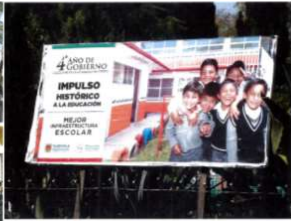
Junto "Casa Artesanías", Tlaxcala