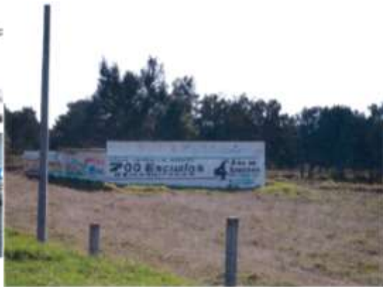
Km. 79 carretera Calpulalpan- Apizaco.