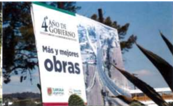
Salida autopista San Martín-Apizaco, Tlaxcala