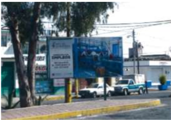
Boulevard Emilio Sánchez Piedras enfrente de la unidad de hemodiálisis a 50 m. de la escuela secundaria general "Mariano Matamoros", Calpulalpan.