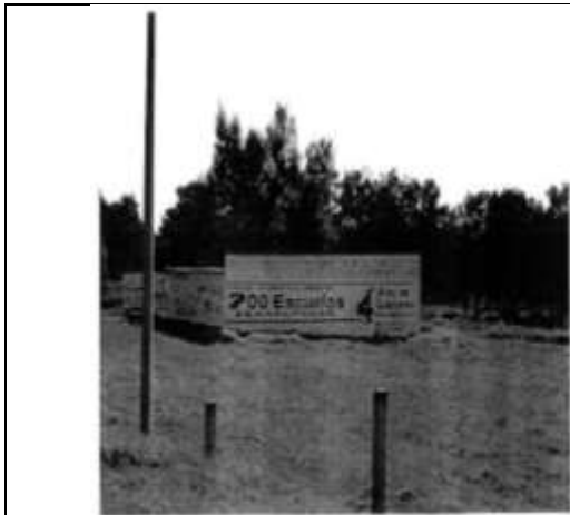
Km. 79 carretera Calpulalpan- Apizaco.