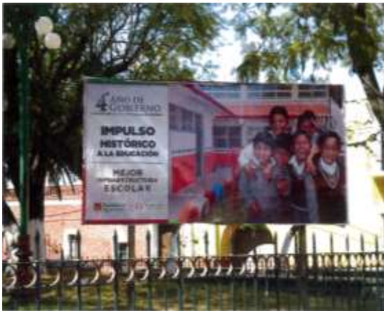
Piazueta Ocotlán, Tlaxcala