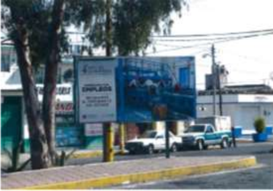
Boulevard Emilio Sánchez Piedras enfrente de la unidad de hemodiálisis a 50 m. de la escuela secundaria general "Mariano Matamoros", Calpulalpan.