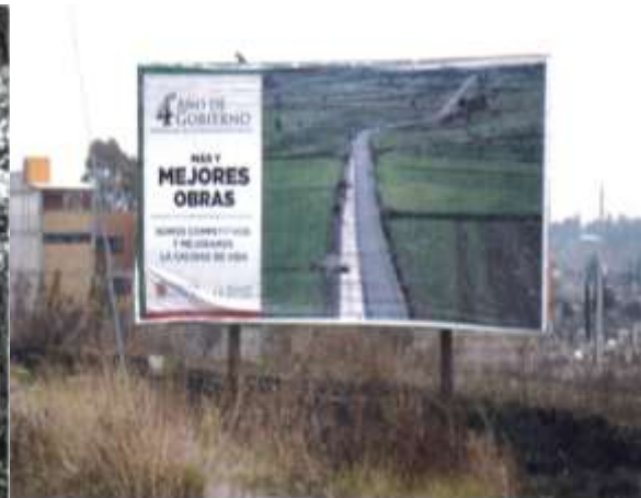
Carretera Texoloc - Tenango salida de Texoloc ultimo tope.