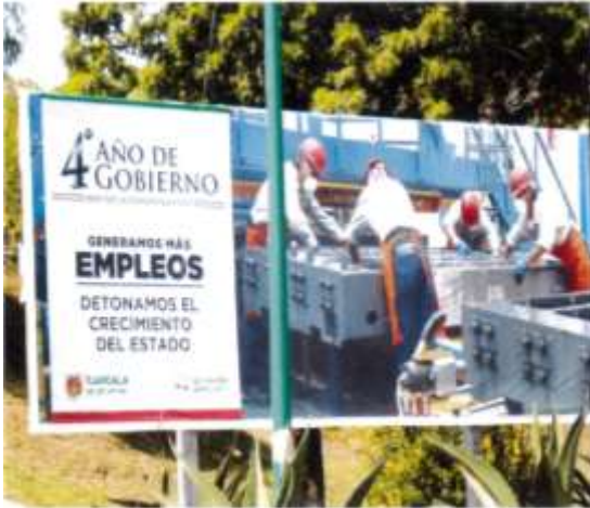
Carretera Apizaco-San Martín entrada al trébol, Tlaxcala