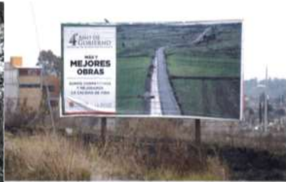
Carretera Texoloc – Tenango salida de Texoloc ultimo tope.