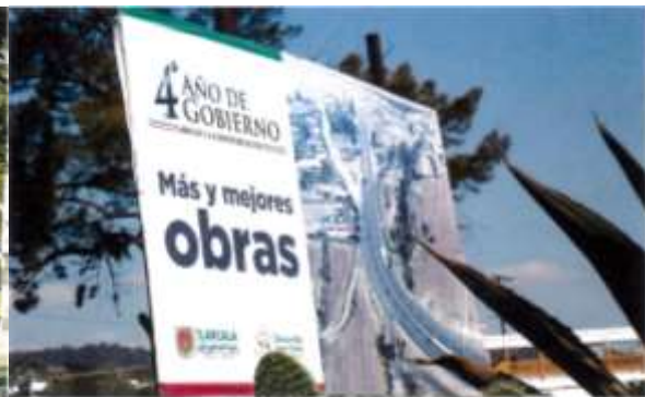
Salida autopista San Martín-Apizaco, Tlaxcala