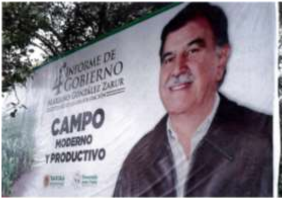
Carretera Santa Ana Portales – Xuxtla, atrás de la iglesia del “Señor de las maravillas”.