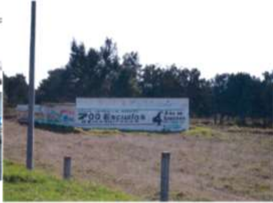
Km. 79 carretera Calpulalpan- Apizaco.