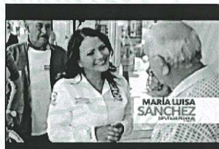
En el Congreso

Finalmente, en un fondo azul aparecen en letras blancas y naranjas las frases ESTE 7 DE JUNIO VOTA POR LOS CANDIDATOS DEL PAN y CAMBIEMOS EL RUMBO DE MÉXICO PAN , observándose por último el emblema del Partido Acción Nacional.