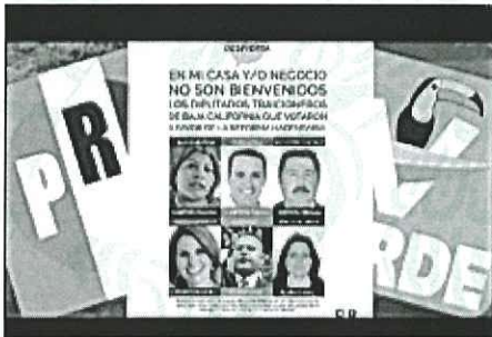
El Partido Verde y el PRI aumentaron el IVA en la frontera al 16%

En seguida se muestran imágenes de lo que al parecer son notas periodísticas que señalan la posibilidad de que el IVA podría incrementarse del 16% al 20%.