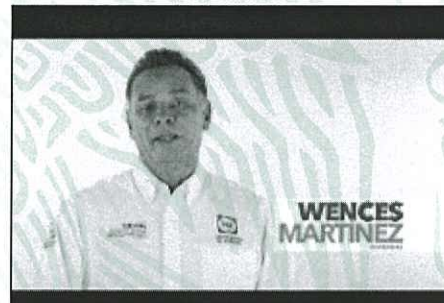
Necesitamos tu apoyo