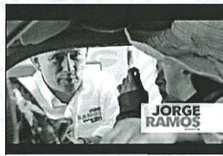
Vamos a bajar el IVA en la frontera