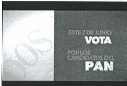
El 7 de junio