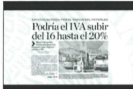
De acuerdo a algunos medios piensan subirlo al 20%

Posteriormente, se observan ocho fotografías de diferentes personas mientras en la pantalla aparecen en letras rojas y verdes las frases Esto No Te Conviene , Cierre de Negocios y Pérdida de Empleos .