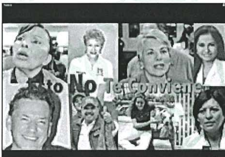
Esto no te conviene

Posteriormente, se observan ocho fotografías de diferentes personas mientras en la pantalla aparecen en letras rojas y verdes las frases Esto No Te Conviene , Cierre de Negocios y Pérdida de Empleos .