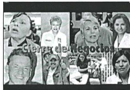
Traerá más cierre de negocios