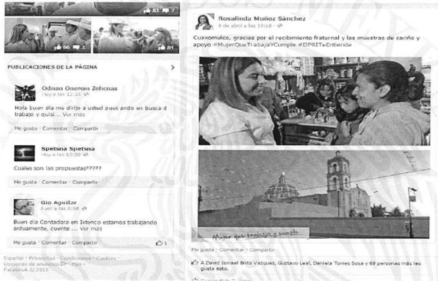
Imagen a la que hace alusión el quejoso en su escrito de denuncia, por lo cual se procedió a dar doble clic en la misma, desplegándose la siguiente pantalla:

En dicha página se aprecian a través de fotografías y mensajes, las actividades que ha ido realizando Rosalinda Muñoz Sánchez, Candidata a Diputada Federal del Distrito uninominal uno en el estado de Tlaxcala, como parte de su campaña, así mismo en la parte inferior de la página en mención se pudo apreciar la siguiente imagen: