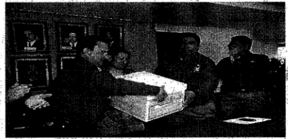
Se afilian al PRI, trabajadores del Isstezac

Por César Ortiz Valdez Juan Carlos Lozano, dirigente estatal de Partido Revolucionario Institucional (PRI), condenó la muerte del diputado federal priista, Moisés Villanueva de la Luz, quien fuera encontrado sin vida el pasado sábado en el municipio de Humantlán, en el estado de Guerrero, señaló que "el partido condena el crimen ante cualquier civil". El también conicido como el Diputado 300 desapareció el pasado 4 de septiembre en el municipio de Talpa, Guerrero. El cuerpo fue encontrado junto con el cadáver de su chófer, estos fueron trasladados a la capital de Guerrero a efecto de hacer la autopsia de ley. Ante el lamentable hecho, el dirigente estatal del PRI afirmó que no se puede descartar que exista un panorama violento rumbo a las elecciones del 2012, pero indicó que si importante no generar miedo a la población. Por eso, hizo un llamado a las tres niveles de gobierno para que asíot garanticen