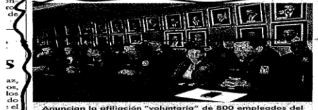
Anunció la afiliación "voluntaria" de 800 empleados del Isstezac.

cretará gobierno del estado, de ahí que se trabajará en la perspectiva presupuestal para el próximo año.