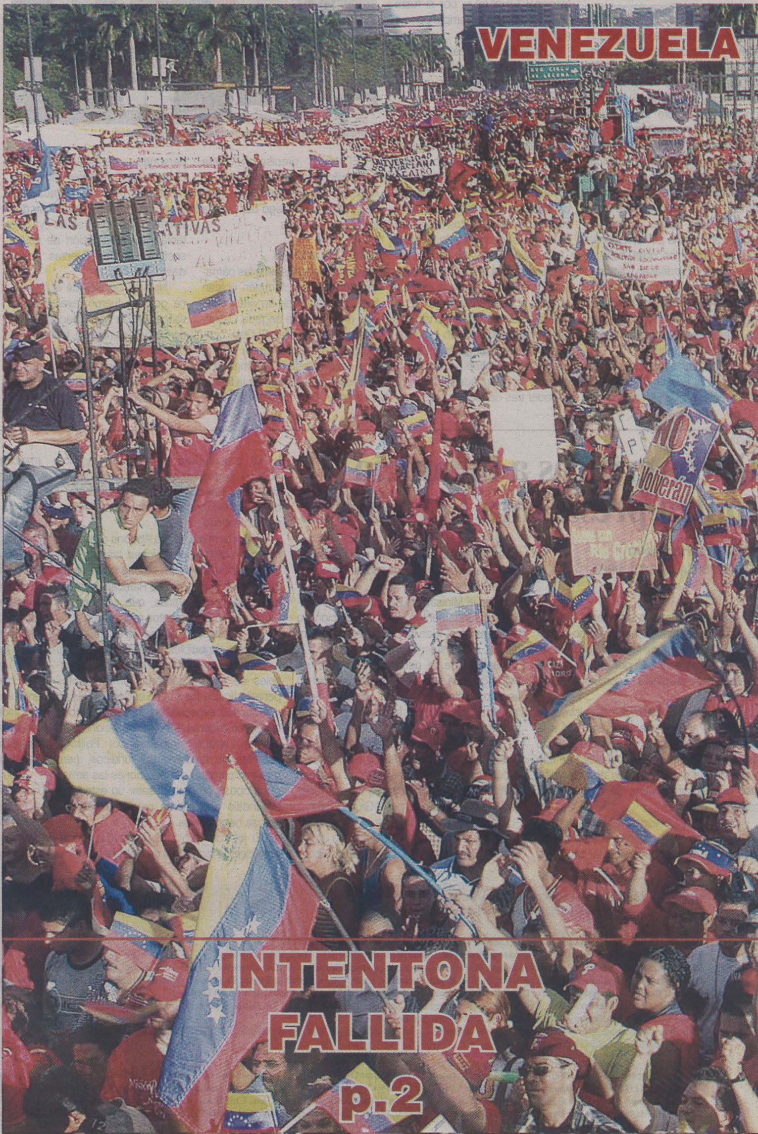
El frustrado golpe concebía masacres en lugares céntricos de Caracas