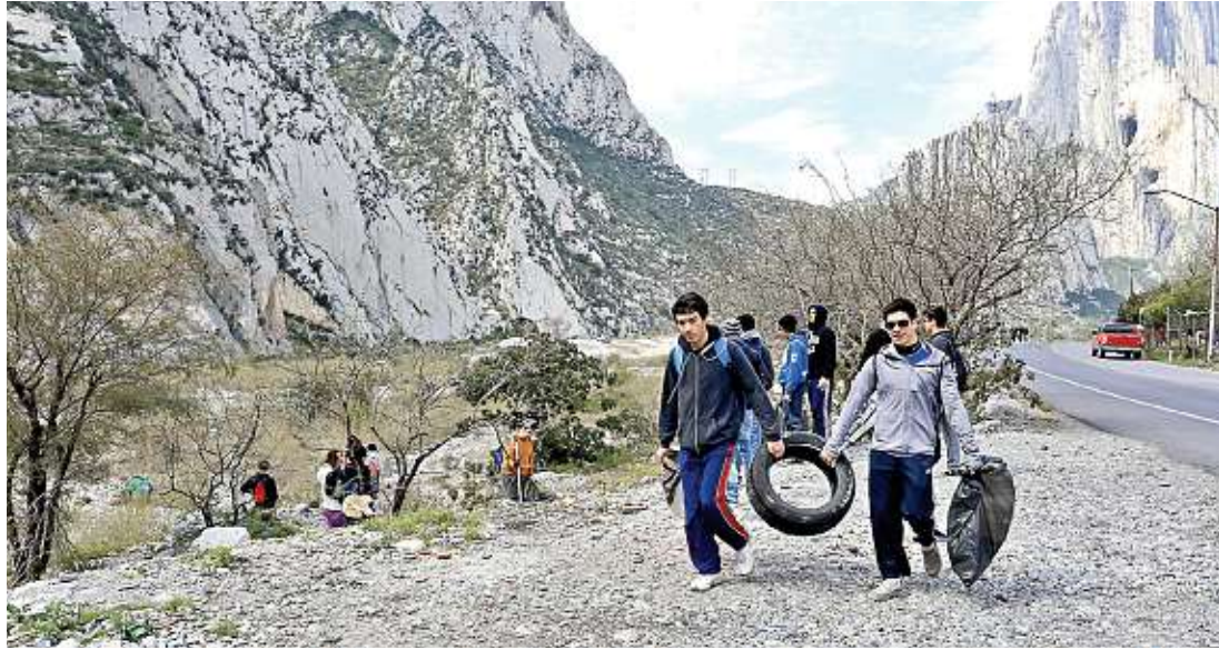
Estudiantes de la Prepa del Tec Cumbres recolectan todo tipo de basura y hasta llantas en el Parque La Huasteca, como parte de una campaña ecológica.