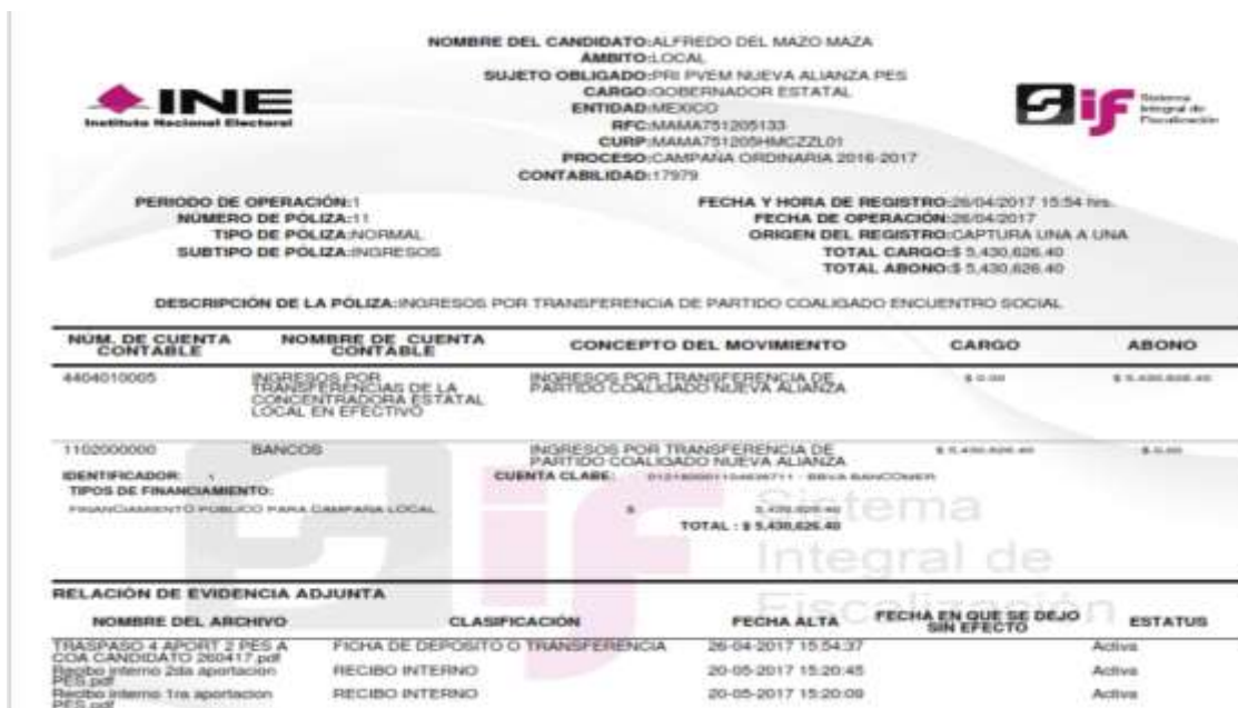
IMAGEN 2. Póliza 11

Asimismo, de un proceso de investigación de la autoridad fiscalizadora, se advirtió que el origen, destino y aplicación de los recursos de la cuenta bancaria *****757, fue el siguiente: