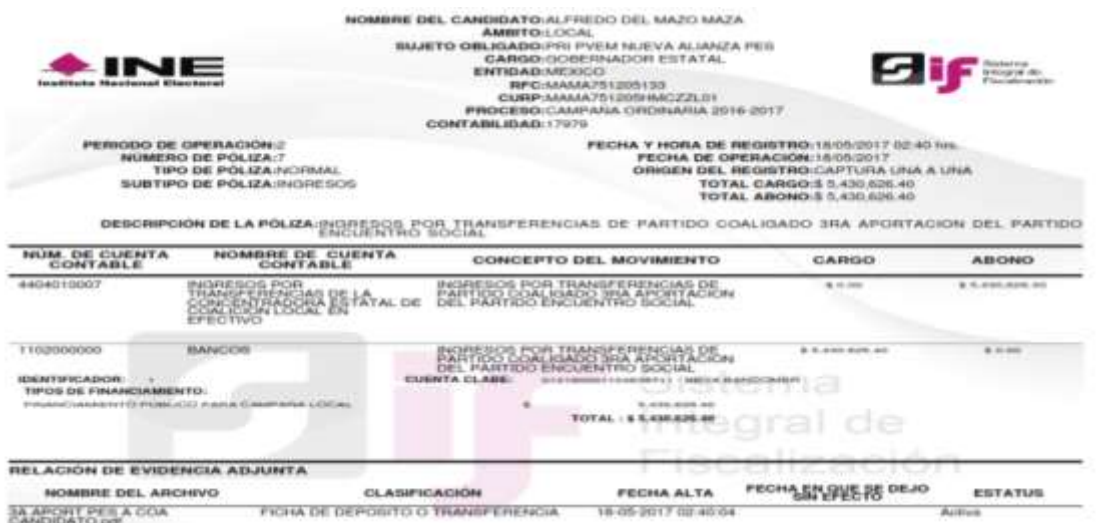
IMAGEN 2. Póliza 7

Póliza número 7: correspondiente a la contabilidad de la Coalición conformada por los partidos Revolucionario Institucional, Verde Ecologista de México, Nueva Alianza y el otrora Encuentro Social en el Estado de México de tipo normal, subtipo ingresos, registrada en fecha dieciocho de mayo de dos mil diecisiete; cuya descripción es la siguiente: INGRESOS POR TRANSFERENCIAS DE PARTIDO COALIGADO 3RA APORTACION DEL PARTIDO ENCUENTRO SOCIAL , con cargo/abono por un monto de $5,430,626.40 (cinco millones cuatrocientos treinta mil seiscientos veintiséis pesos 40/100 M.N.):