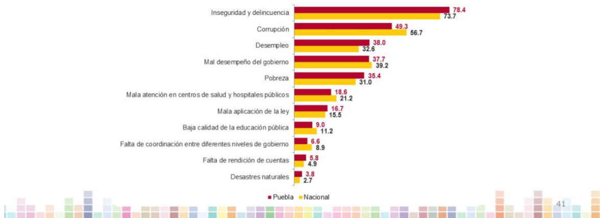
Percepción sobre problemas más importantes en su entidad federativa

En Puebla , 78.4% de la población de 18 años y mas refirió que la inseguridad y delincuencia es el problema más importante que aqueja hoy en día su entidad federativa, seguido de la corrupción con 49.3% y el desempleo con 38% .