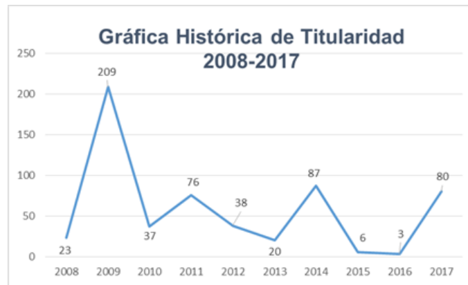
Gráfica 1. Titularidad

Cabe destacar que para el período que se reporta, en el cuerpo del Servicio para el sistema INE se otorgaron 83 nombramientos de Titularidad, a igual número de MSPEN cantidad significativa que puede apreciarse en la siguiente gráfica: