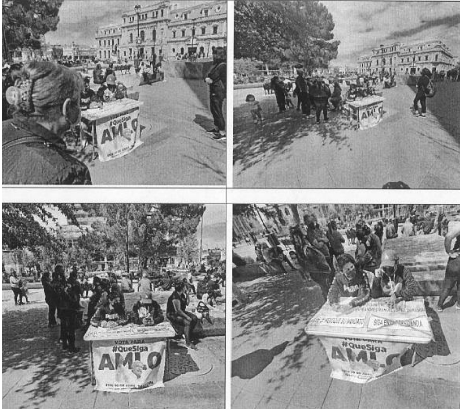
Imagen del folleto