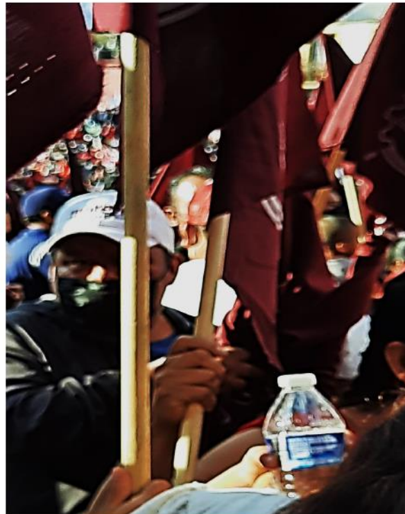
Imagen 9: Persona del sexo masculino con gorra del Partido Morena, repartiendo banderas de color guinda con la “LEYENDA MOVIMIENTO DE ACCIÓN SOCIAL”

No obstante, se considera que se trata de un hecho aislado que no puede servir de base para el dictado de medidas cautelares, en los términos y para los efectos que pretende el quejoso, porque, se insiste, no existe prueba en el sentido de que el partido político MORENA haya ordenado, pagado o solicitado un acto de ese tipo, ni tampoco que la asociación lo haya solicitado, debiéndose tomar en cuenta que ese tipo de asambleas o eventos son públicos o abiertos a la ciudadanía, de lo que se sigue que cualquier persona puede ingresar, participar y manifestarse utilizando para ello atuendo, ropa o accesorios de un partido político.