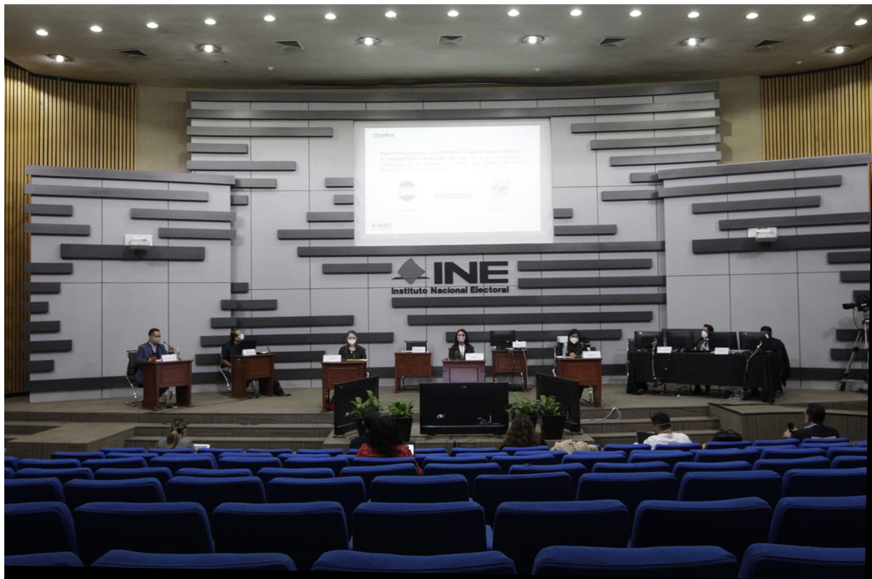
Imagen 1. Espacios que se utilizarán este 10 de abril de 2022 para el escrutinio y cómputo.

De acuerdo con el numeral 37 de los LOVEIRM, el Local Único para la instalación, integración y funcionamiento de la MEC Electrónica en la que se realizará el cómputo y resultados de los votos emitidos por las y los mexicanos residentes en el extranjero para el PRM, serán las Oficinas Centrales del INE con domicilio en Viaducto Tlalpan 100 Edificio B, Colonia Arenal Tepepan, Alcaldía de Tlalpan, C.P. 14610 Ciudad de México, específicamente en el Auditorio del Edificio B.