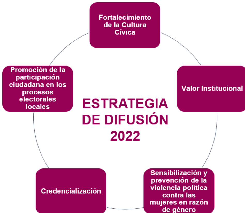
Ilustración 2 Campañas Institucionales

La Estrategia de Difusión 2020-2021 plantea cinco campañas: