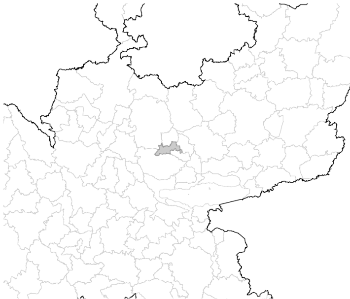
Mapa 2. Ubicación del municipio San Pedro Tlaquepaque, Jalisco.

En Iliatenco, Guerrero la lista nominal aprobada para el día de jornada electoral del 6 de junio fue de 7,108 ciudadanos y ciudadanas, distribuidos en 6 secciones, por lo que para la elección ordinaria fue aprobada la instalación de 14 casillas.