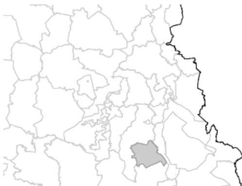
Mapa 3. Ubicación del municipio Iliatenco, Guerrero.

En Iliatenco, Guerrero la lista nominal aprobada para el día de jornada electoral del 6 de junio fue de 7,108 ciudadanos y ciudadanas, distribuidos en 6 secciones, por lo que para la elección ordinaria fue aprobada la instalación de 14 casillas.