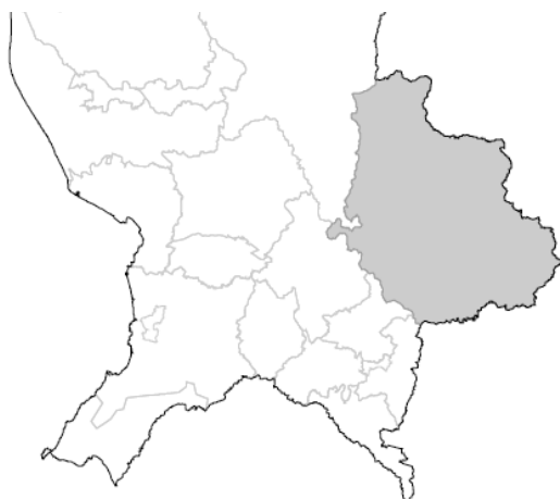
Mapa 5. Ubicación del municipio de La Yesca en Nayarit.

En La Yesca, Nayarit la lista nominal utilizada el día de jornada electoral del 6 de junio estuvo conformada por 8,349 ciudadanos y ciudadanas, distribuidos en 11 secciones, por lo que para la elección ordinaria fue aprobada la instalación de 20 casillas.