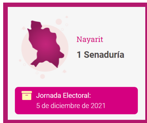
Ilustración 1. Elección Extraordinaria Nayarit

El arranque de actividades para la celebración de este Proceso Electoral Extraordinario deriva de la emisión de la Convocatoria, aprobada por la Cámara de Senadores. Esta convocatoria mandata la celebración de comicios en Nayarit, ante la vacancia en un cargo de Senaduría por ausencia del propietario y del respectivo suplente.