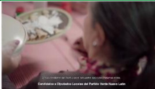
y estas propuestas resuelven problemas reales. (Candidatos a Diputados Locales del Partido Verde Nuevo León)