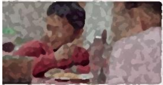
y estas propuestas resuelven problemas reales. (Candidatos a Diputados Locales del Partido Verde Nuevo León)