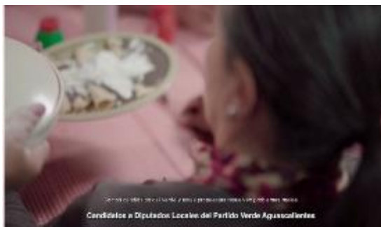
y estas propuestas resuelven problemas reales. (Candidatos a Diputados Locales del Partido Verde Aguascalientes)