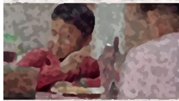
y estas propuestas resuelven problemas reales. (Candidatos a Diputados Locales del Partido Verde Baja California Sur)