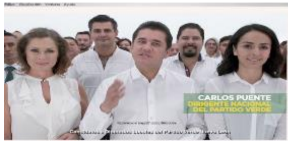
Queremos seguir cumpliéndote. (Candidatos a Diputados Locales del Partido Verde Nuevo León)