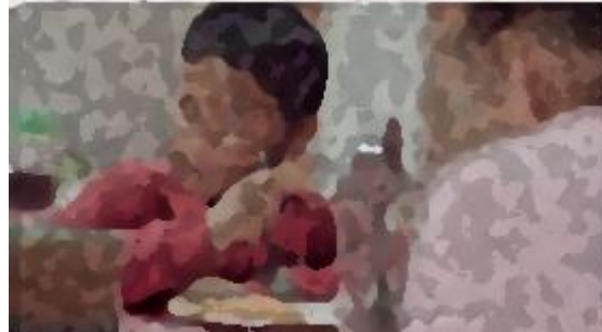
y estas propuestas resuelven problemas reales. (Candidatos a Diputados Locales del Partido Verde Michoacán)