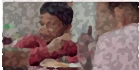
y estas propuestas resuelven problemas reales. (Candidatos a Diputados Locales del Partido Verde Durango)