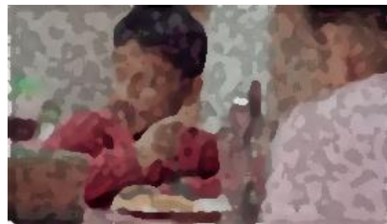
y estas propuestas resuelven problemas reales. (Candidatos a Diputados Locales del Partido Verde Aguascalientes)