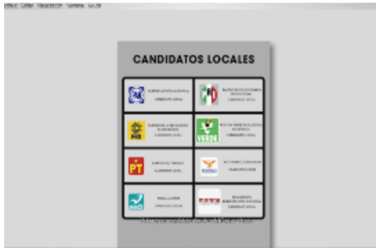
Vota por los candidatos locales del Partido Verde.