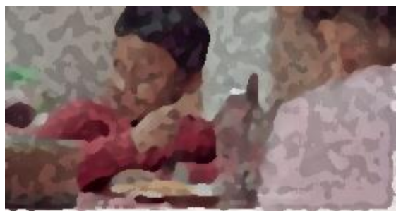
y estas propuestas resuelven problemas reales. (Candidatos a Diputados Locales del Partido Verde Guerrero)