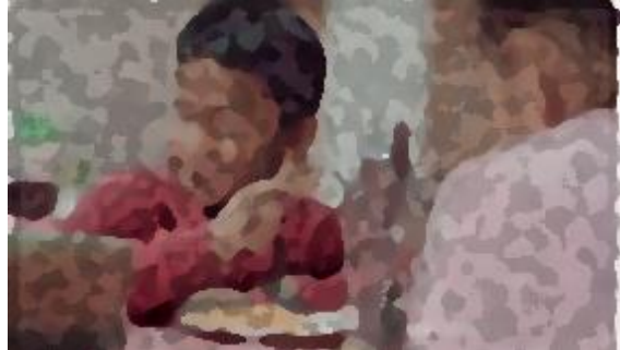
y estas propuestas resuelven problemas reales. (Candidatos a Diputados Locales del Partido Verde Chihuahua)