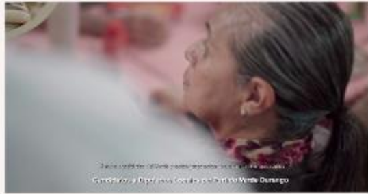
y estas propuestas resuelven problemas reales. (Candidatos a Diputados Locales del Partido Verde Durango)