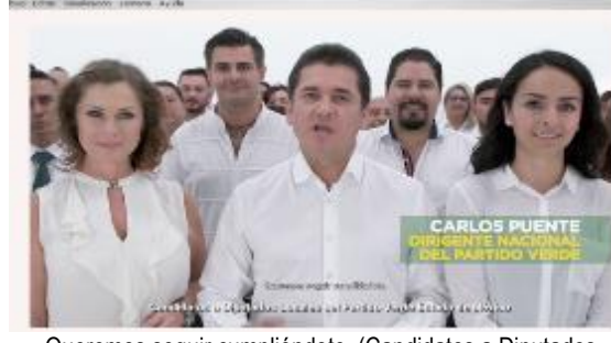
Queremos seguir cumpliéndote. (Candidatos a Diputados Locales del Partido Verde Estado de México)