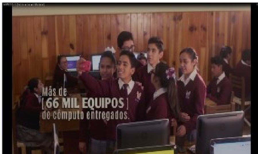
(SEIS MENORES DE EDAD)

Al respecto, de las constancias que obran en autos, se advierte que existe permiso o autorización por parte de la madre de la niña que aparece dicha imagen, además de opinión libre y razonada de la niña cuya imagen fue utilizada en el spot que se estudia. Por lo que se estima que, de un análisis preliminar, que el derecho de la menor de edad en comento, quedó salvaguardado para efectos de la medida cautelar.