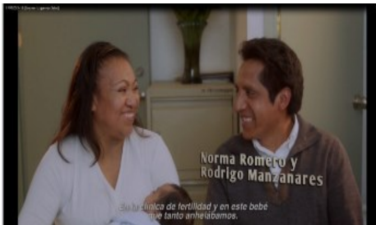
IMAGEN REPRESENTATIVA 18

En principio, para la válida emisión del presente acuerdo, resulta necesario tener en cuenta el contenido del promocional Creo en lo que veo Salud con número de folio RV02024-16 , en cuanto hace a la aparición del menor de edad como se aprecia a continuación: