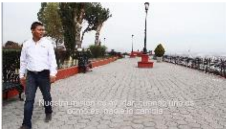
Nuestra misión es ayudar, cuando uno es como es, nadie lo cambia.

La verdad, Coahuila la tiene, ¡es tu decisión!