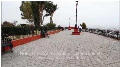
Nuestra misión es ayudar, cuando uno es como es, nadie lo cambia.

Si piensas que el trabajo es un juego, no te equivoques, porque hay gente que lo espera.