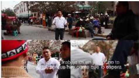
Si piensas que el trabajo es un juego, no te equivoques, porque hay gente que lo espera.

La verdad, Coahuila la tiene, ¡es tu decisión!