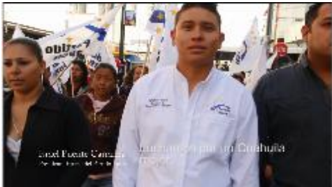
Luchamos por un Coahuila mejor.