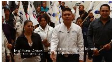
Ellos creen que son la neta, no te equivoques.