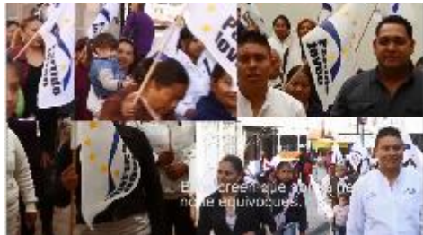
Ellos creen que son la neta, no te equivoques.