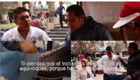
Si piensas que el trabajo es un juego, no te equivoques, porque hay gente que lo espera.

No te equivoques, hay un camino, Partido Joven.