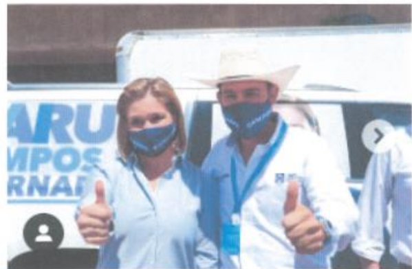
Imagen cuarenta y cuatro