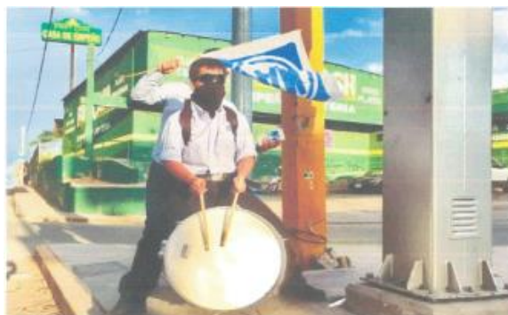
Imagen ciento cuatro