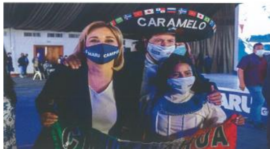
Imagen noventa y cinco