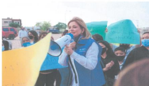
Imagen sesenta y dos