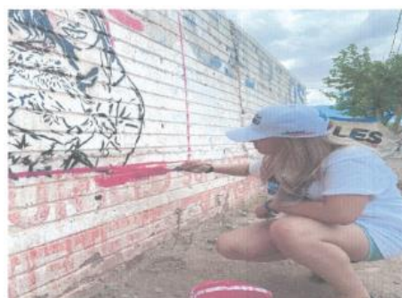
Imagen setenta y ocho