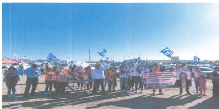
Imagen ochenta y seis