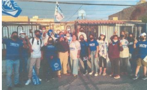
Imagen ciento tres