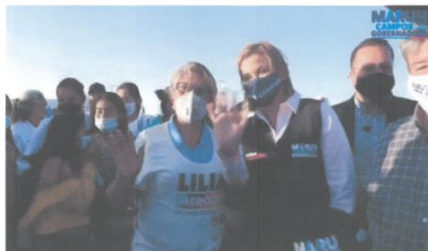
Imagen cincuenta y ocho