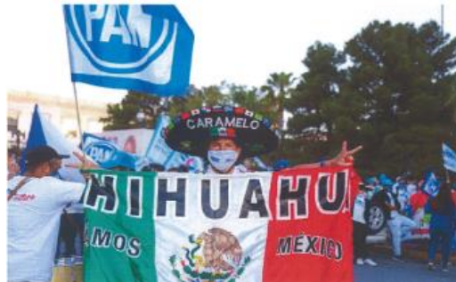
Imagen ciento nueve