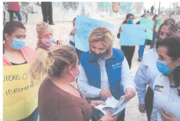
Imagen sesenta y cinco