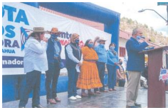
Imagen ciento uno