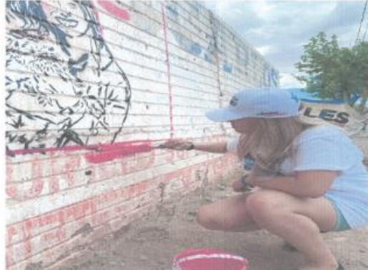
Imagen setenta y siete