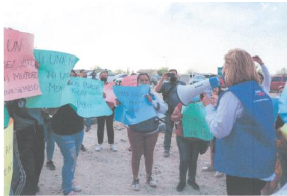
Imagen sesenta y cuatro