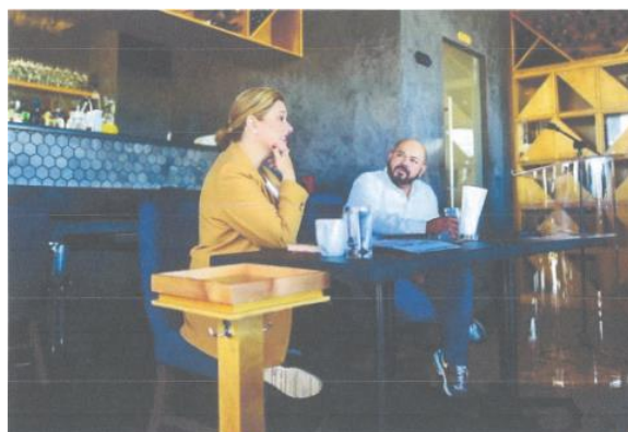
Imagen cincuenta y nueve