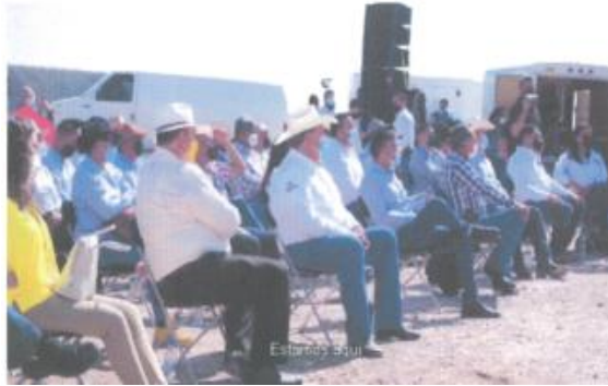
Imagen noventa y tres