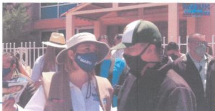
Imagen treinta y cinco