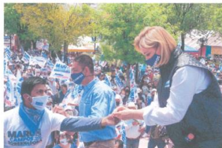
Imagen ochenta y cuatro