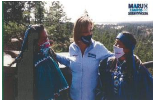
Imagen noventa y ocho