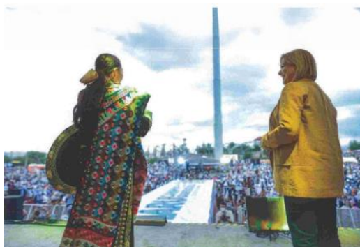
Imagen ochenta y nueve