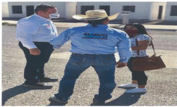
Imagen cuarenta y nueve