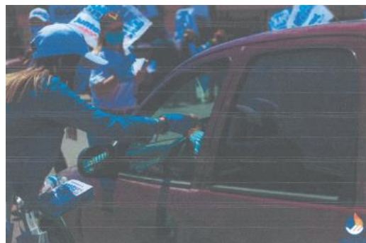
Imagen noventa y dos