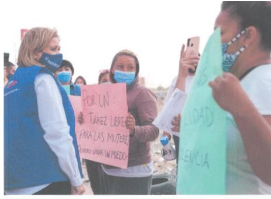
Imagen sesenta y siete