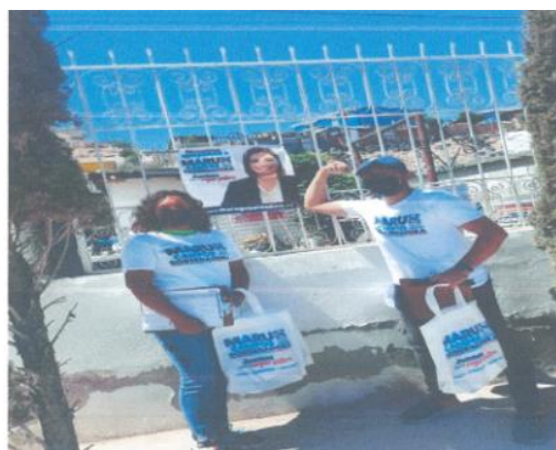
Imagen ochenta y tres