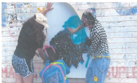
Imagen setenta y uno