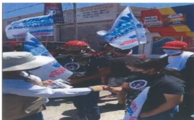
Imagen treinta y ocho