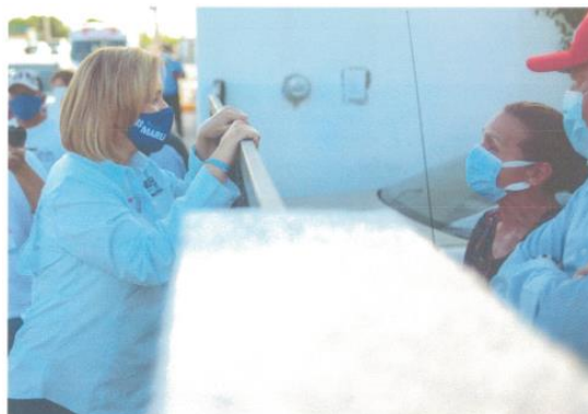
Imagen cincuenta y tres