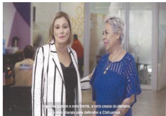
Imagen ciento siete