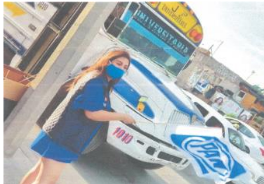
Imagen ciento seis