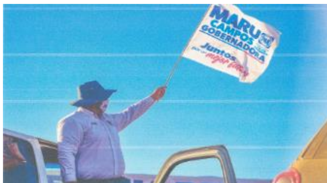
Imagen treinta y siete