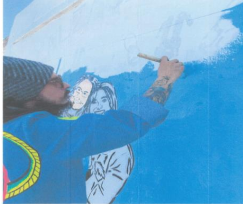
Imagen setenta y seis