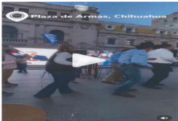
Imagen cuarenta y seis