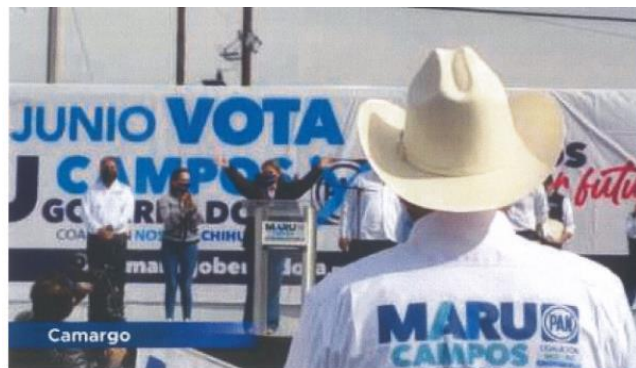
Imagen cuarenta y siete