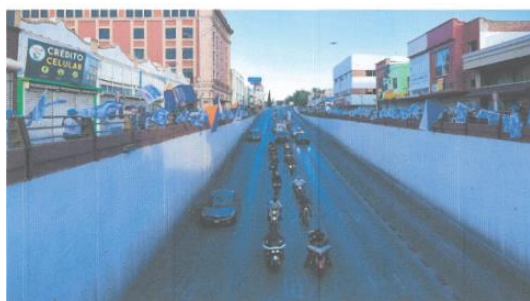
Imagen setenta y nueve