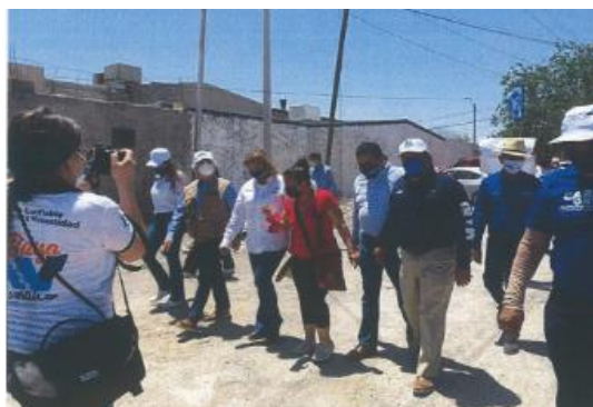
Imagen setenta y tres