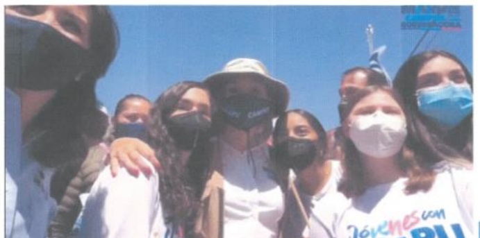
Imagen treinta y cuatro