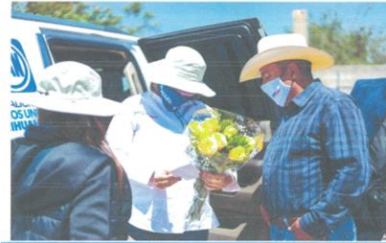
Imagen cincuenta y dos