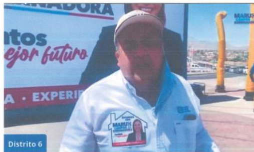
Imagen sesenta y uno