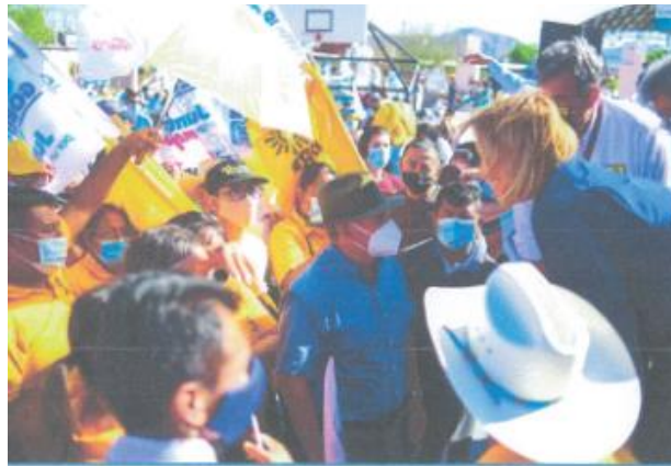
Imagen cincuenta y seis