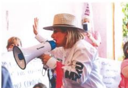
Imagen setenta y cuatro