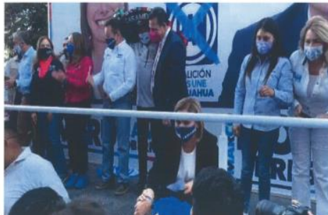
Imagen ochenta y cinco