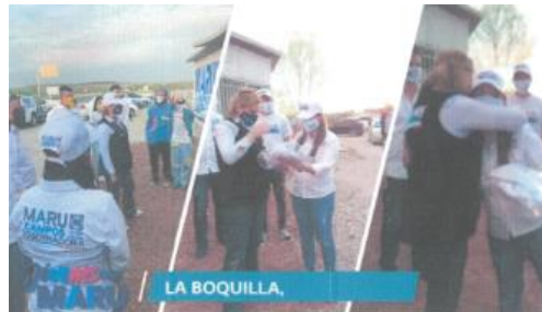
Imagen noventa y uno