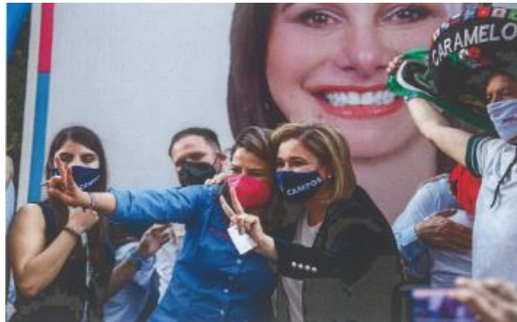
Imagen noventa y siete