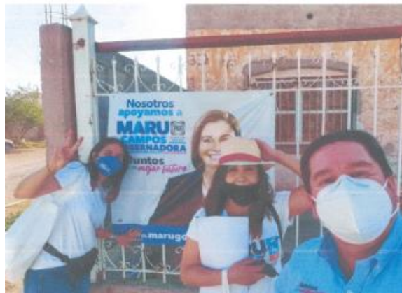
Imagen cuarenta y uno