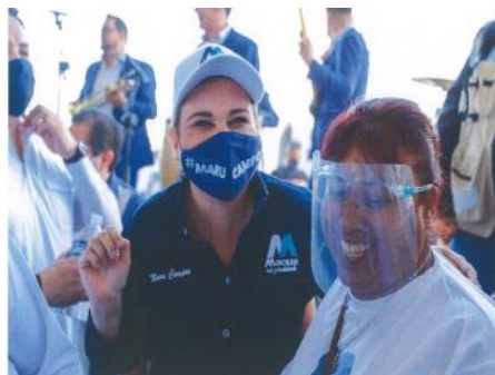
Imagen ochenta y ocho