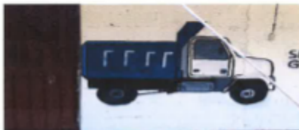
Barda numero seis: