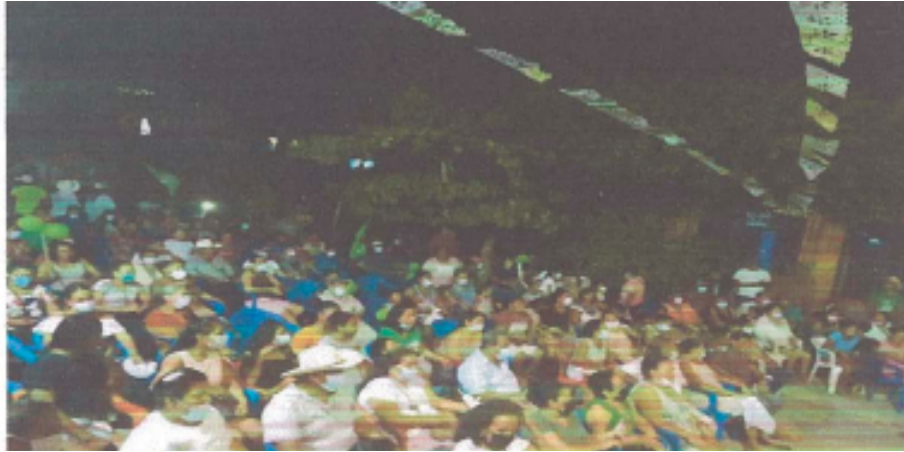
• Recorrido por las colonias del municipio de Copela, Guerrero en donde entrega camisas y mochilas.