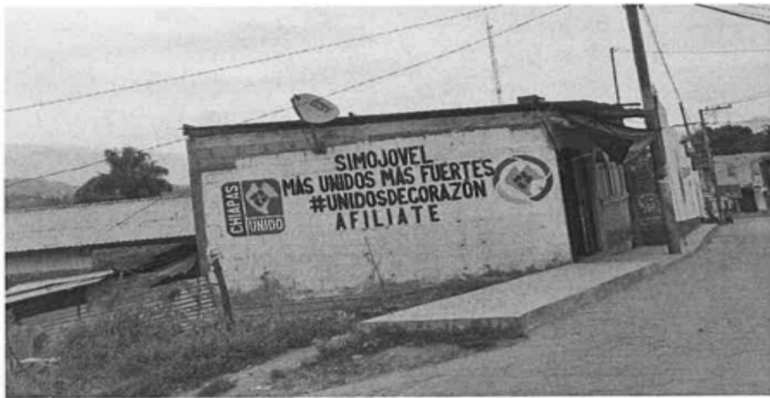
AVENIDA CONSTITUCIÓN, SIMOJOVEL DE ALLENDE, CHIAPAS