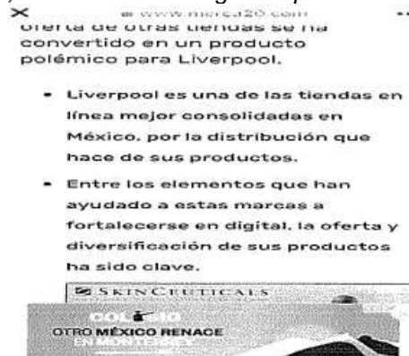
Imagen 1: Propaganda en la página la página www.merca20.com

A continuación, se insertan las imágenes que dan cuenta de lo anterior: