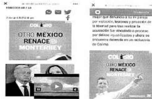
Imágenes 2 y 3: Propaganda fijada en las páginas en las páginas www.aristequinoticias.com y www.reporteindigo.com