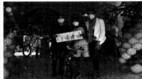
Imagen 3 con fecha 6 de enero de 2021:

https://www.facebook.com/photo?fbid=146066770944683&set=pcb.1460653497612677