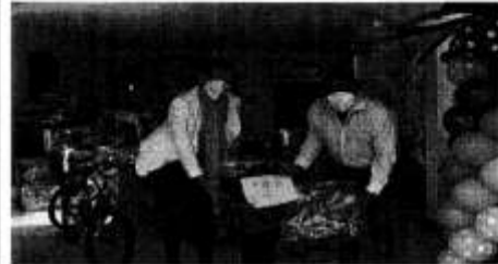
Imagen 2 con fecha 6 de enero de 2021:

https://www.facebook.com/photo?fbid=146066730844687&set=pcb.1460653497612677