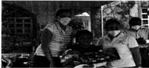
Imagen 4 con fecha 6 de enero de 2021:

https://www.facebook.com/photo?fbid=146066847811342&set=pcb.1460653497612677