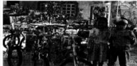
Imagen 6 con fecha 6 de enero de 2021:

https://www.facebook.com/photo?fbid=1460667020944658&set=pcb.1460653497612677