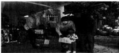
Imagen 5 con fecha 6 de enero de 2021:

https://www.facebook.com/photo?fbid=1460668804278004&set=pcb.1460653497612677