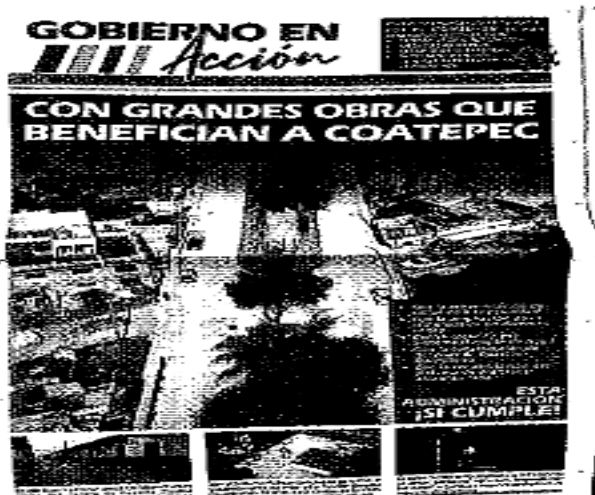
IMAGEN 1 PORTADA DEL EJEMPLAR IMPRESO. -

Imágenes que se anexan y describen a continuación: