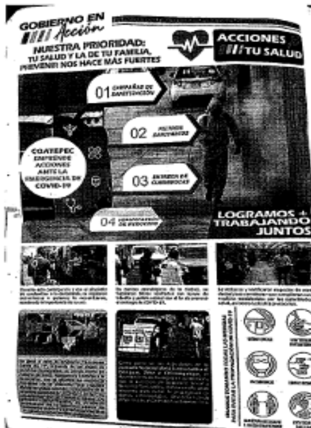
IMAGEN 2 (ACCIONES CONTRA COVID)

De la que se observa se graficó a letra mayúscula, molde ancho y formato de letra amplia, esto con la intención de aludir de forma tajante el cumplimiento de la administración del actual municipio.