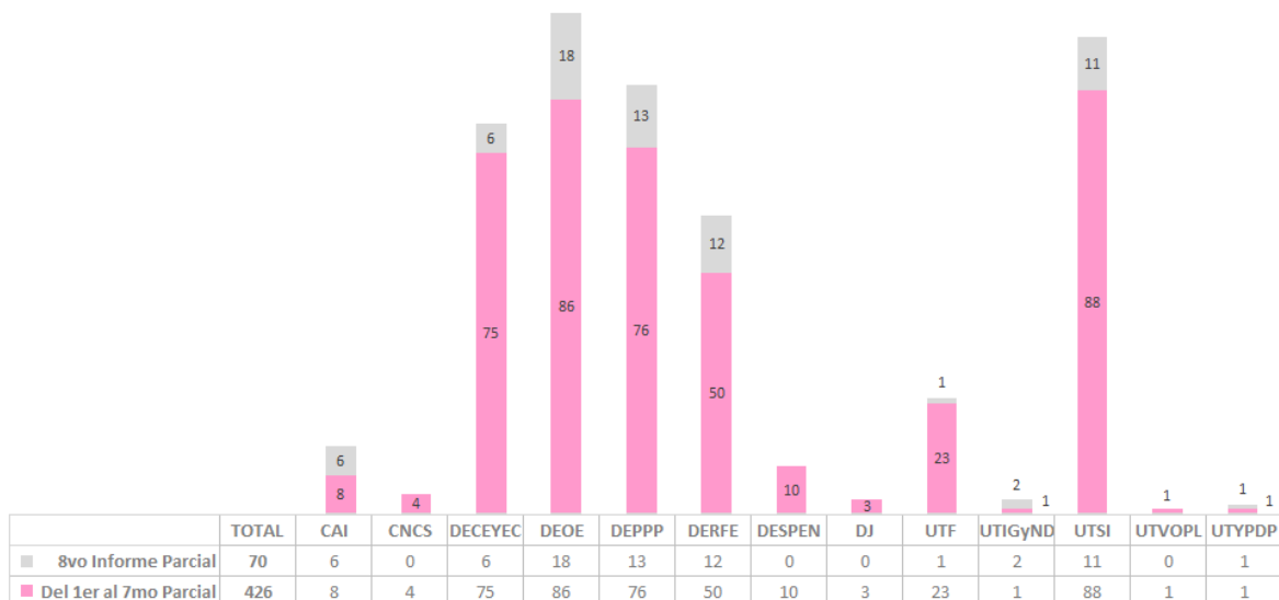
Gráfica 1. Distribución del número de actividades concluidas, por UR