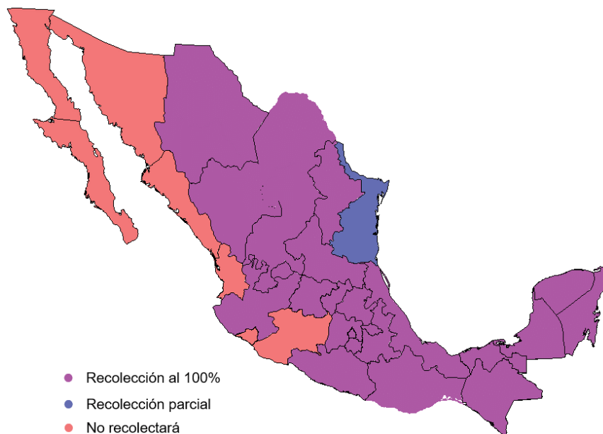
Mapa 2 Tipo de recolección que realizará la CONALITEG, por entidad federativa