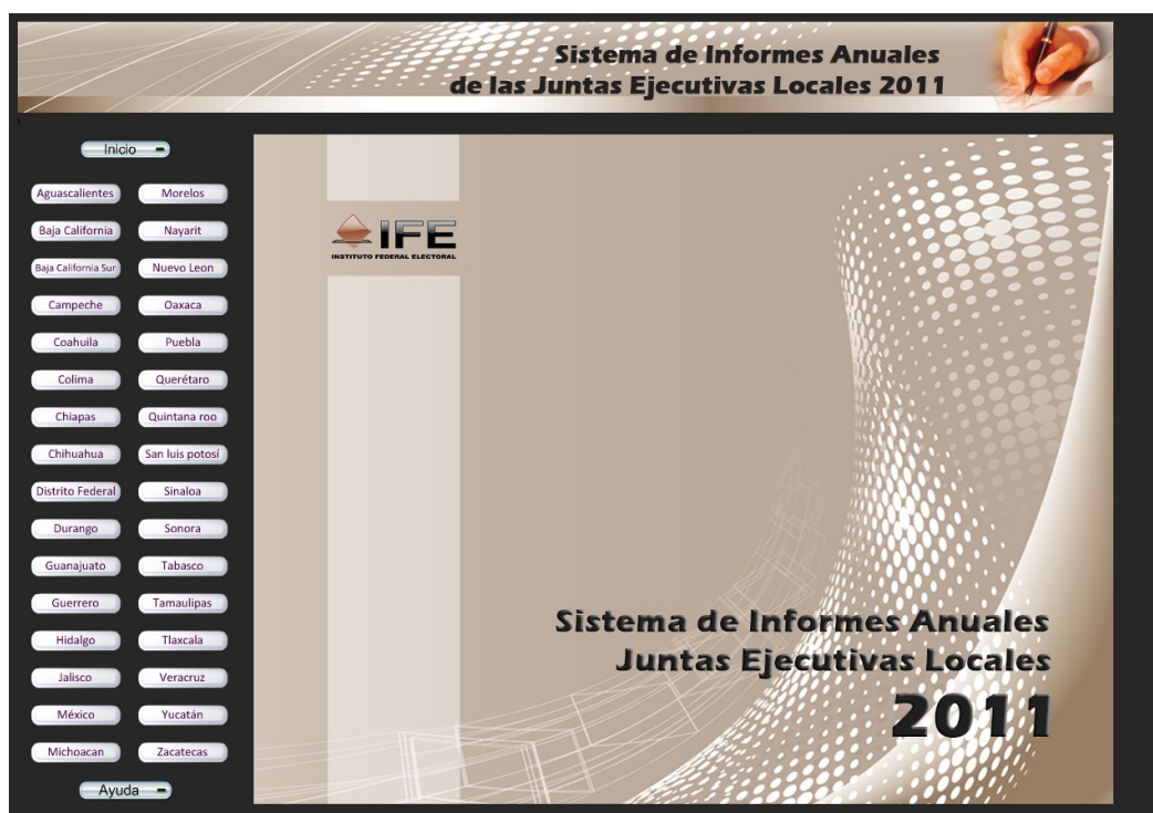
Imagen 1. Pantalla principal del Sistema

A continuación esta pantalla se divide en tres elementos: