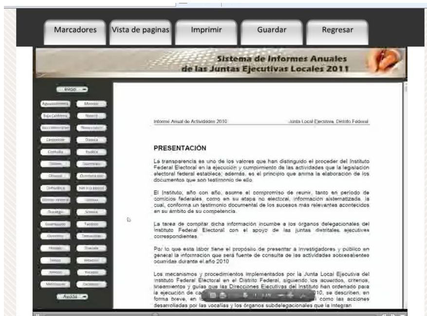
Imagen 3. Videos tutoriales de ayuda

El 31 de octubre de 2012, en la sesión ordinaria de la Comisión de Organización Electoral se presentó el esquema general de esta aplicación informática, en la misma se detalló la forma en que operará dicho sistema y de los pendientes por concluir de la actividad. Cabe señalar que no se recibieron observaciones respecto a la interfaz de dicho sistema.