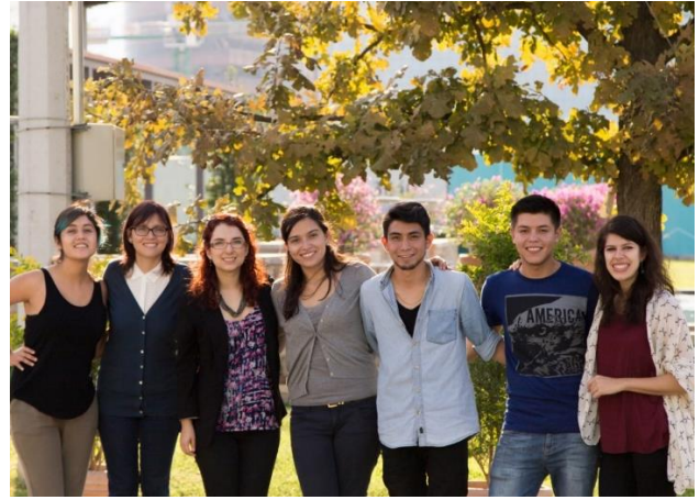
Foto: Taller de Lecciones Aprendidas. Vía Educación. Nuevo León