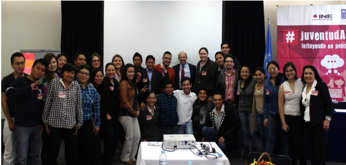
Foto: Primer día de trabajo en el Taller de intercambio y lecciones aprendidas. Ciudad de México

clave para la evaluación de sus propuestas. Asimismo, con el objetivo de mejorar el proceso de aprendizaje se realizaron ejercicios individuales y en grupo.