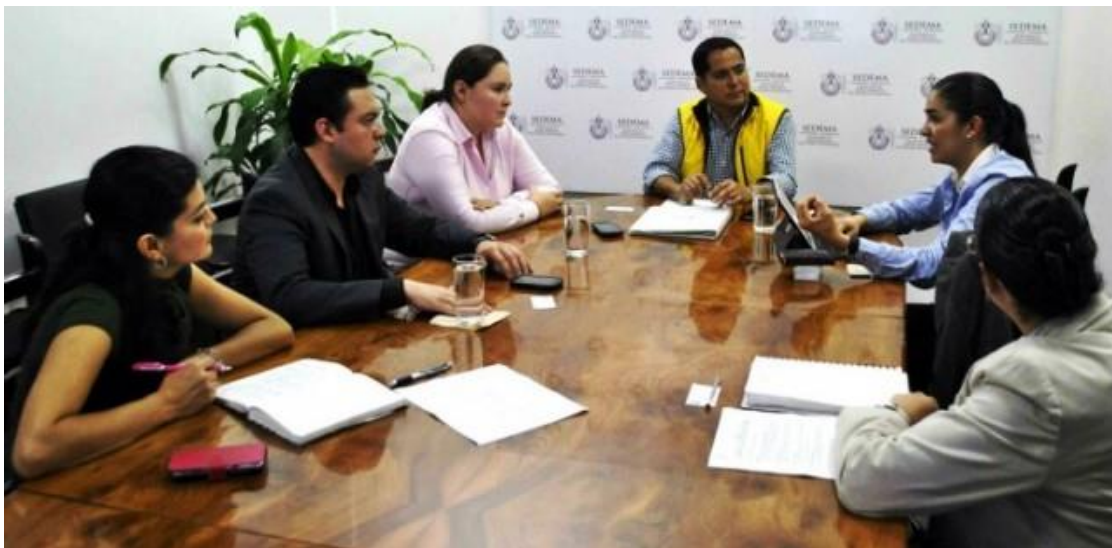
Foto: Reunión de trabajo y acompañamiento al equipo ECOCINA. Veracruz