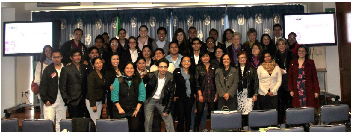
Foto: Reunión entre las y los jóvenes participantes de #JuventudActúaMX y miembros de la Comunidad de Práctica. Sede de las Naciones Unidas en México.

De la evaluación final de conocimientos que hicieron las y los jóvenes de esta tercera etapa del proceso #JuventudActúaMX resalta que las respuestas que dieron la mayoría de los participantes fueron más producto de su experiencia que de conceptos teóricos. En estas evaluaciones expresaron