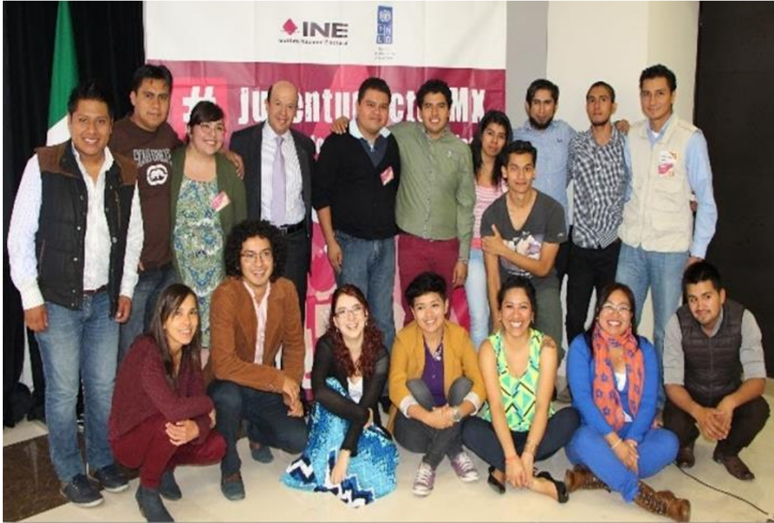
Foto: Taller para Promotores de Participación Ciudadana. Ciudad de México