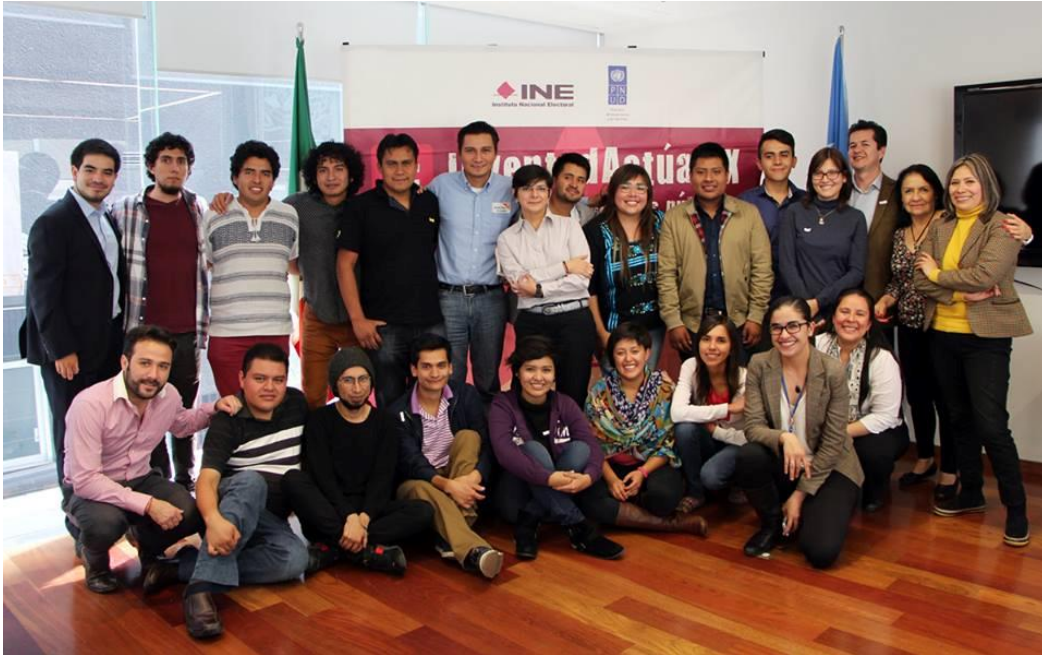
Foto: Taller Nacional de Lecciones Aprendidas. Sede de las Naciones Unidas- México