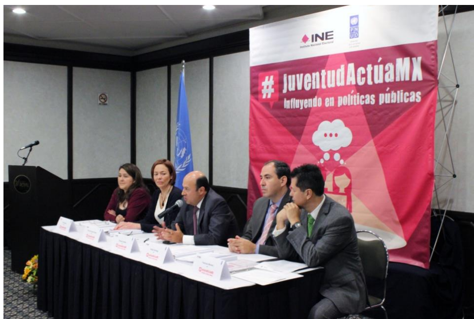
Foto: Inauguración del Diplomado Liderazgos juveniles e incidencia en política pública: Conceptos e instrumentos . Ciudad de México