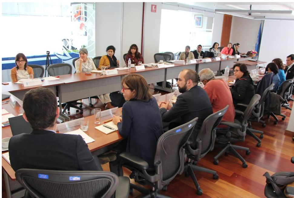
Foto: Segundo Encuentro con los Directores. Sede de las Naciones Unidas- México