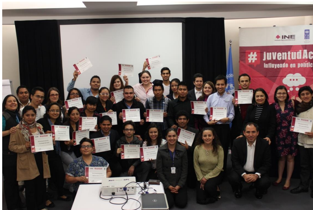
Foto: Ceremonia de Clausura del Taller de intercambio y Lecciones Aprendidas. Ciudad de México