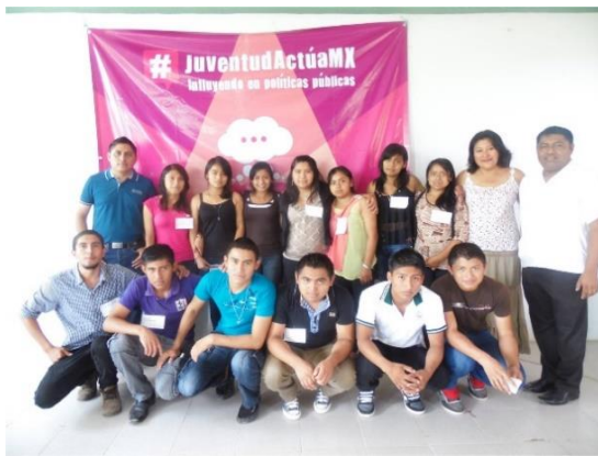
Foto: Taller de formación. ZADCE. Chiapas.