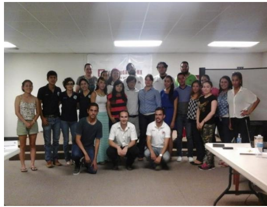
Foto: Taller de formación. CIDESES. Chihuahua