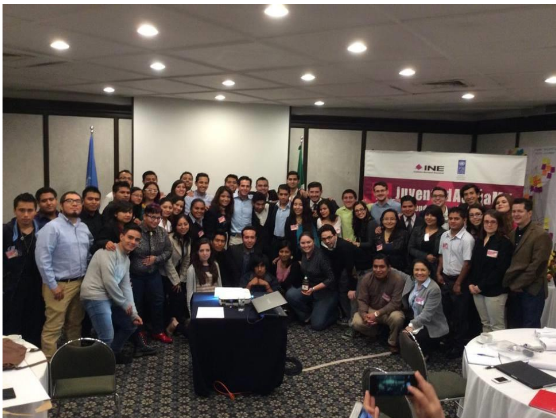
Foto: Diplomado Liderazgos juveniles e incidencia en política pública: Conceptos e instrumentos . Ciudad de México

Para cumplir con el objetivo final del Diplomado de tener un plan para la incidencia en políticas públicas fue necesario hacer un análisis más detallado de cada una de las propuestas en términos de sus objetivos, estrategias y alcances. Al concluir la capacitación, todos los participantes lograron reestructurar y plantear de mejor forma su proyecto.