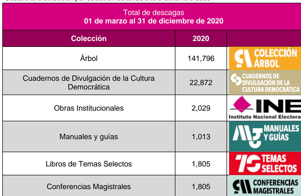
Cuadro 2. Distribución por colección editorial, enero-diciembre 2020