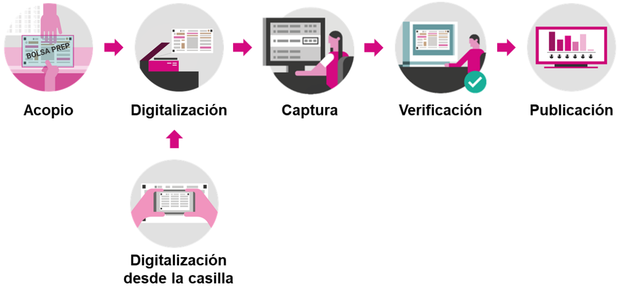
Esquema 2. El OPL de Ciudad de México tiene la siguiente secuencia para el PREP: