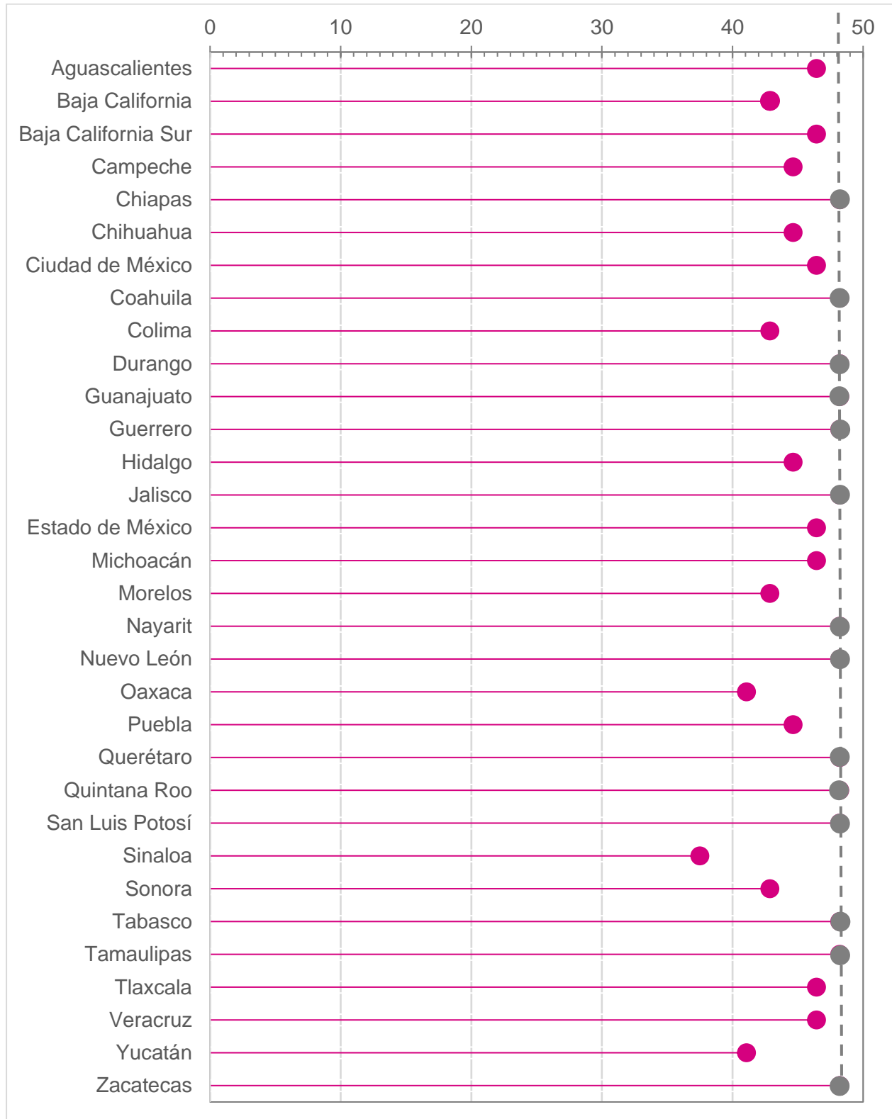
Gráfica 1. Resumen del avance acumulado por OPL al 15 de febrero