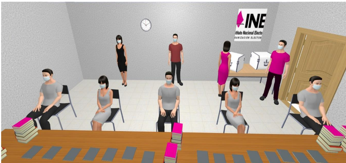
Imagen 2a Vista en tres dimensiones del modelo de distribución de personas en un Punto de Recuento (vista horizontal)

Nota: Los modelos presentados son para efectos ilustrativos de este Protocolo.