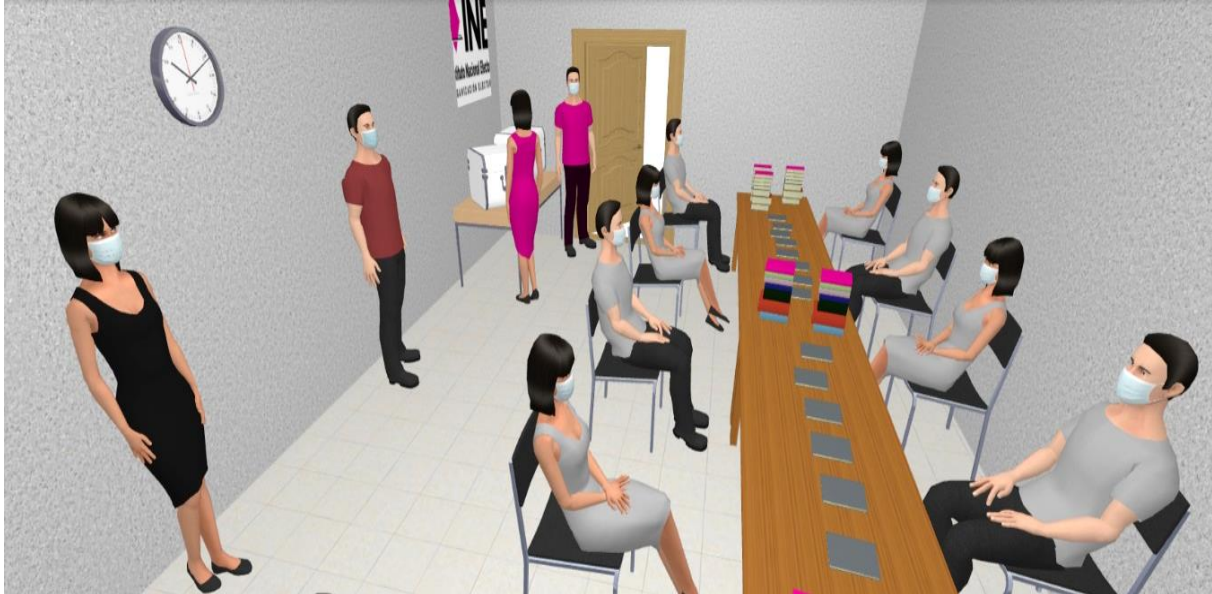
Imagen 3 Vista en tres dimensiones del modelo de distribución de personas en un Punto de Recuento (vista vertical)

Nota: Los modelos presentados son para efectos ilustrativos de este Protocolo.