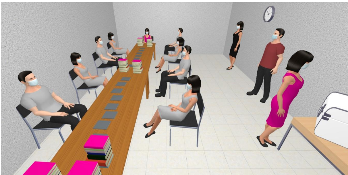
Imagen 3b Vista en tres dimensiones del modelo de distribución de personas en un Punto de Recuento (vista vertical)

Nota: Los modelos presentados son para efectos ilustrativos de este Protocolo.