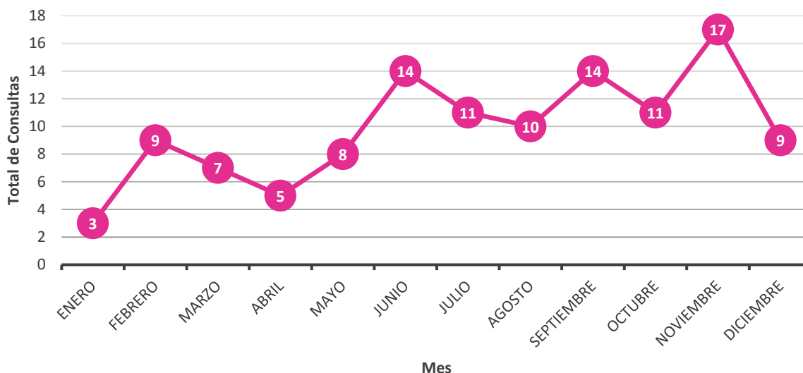
Gráfica 1. Consultas formuladas por mes (Al 9 de diciembre de 2020)

La cifra total de consultas presentadas por los OPL del 1 de enero Al 9 de diciembre de 2020 , asciende a 118 escritos de consulta. De acuerdo con la siguiente gráfica, el Instituto ha recibido el mayor número de consultas durante el mes de noviembre , llegando a un total de 17 .