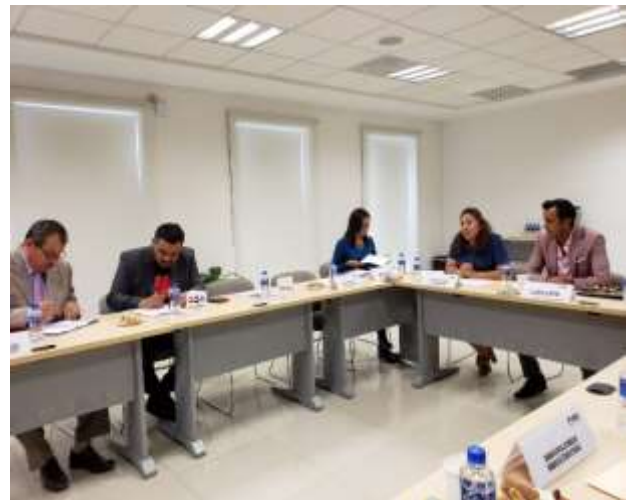
Mesa de diálogo Junta Local Ejecutiva de Hidalgo

Una vez que las mesas de diálogo se llevaron a cabo, las y los VCEyEC remitieron a la DECEyEC las minutas de trabajo generadas en las mismas, de las cuales es importante destacar algunos elementos, que a continuación se señalan. La información detallada puede consultarse en el Anexo 2 Reporte del desarrollo de las mesas de diálogo .