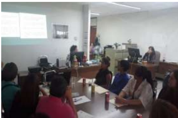
Grupo de enfoque con SE y CAE en la Junta Distrital Ejecutiva 02 en el estado de Aguascalientes