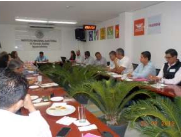
Mesa de diálogo, Junta Distrital Ejecutiva 03 de Aguascalientes