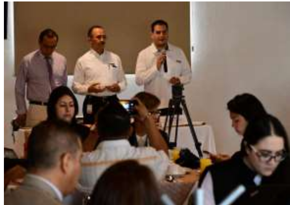
Mesa de diálogo Junta Local Ejecutiva de Veracruz