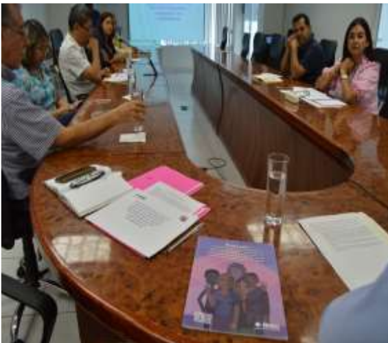
Mesa de diálogo Junta Local Ejecutiva de Colima