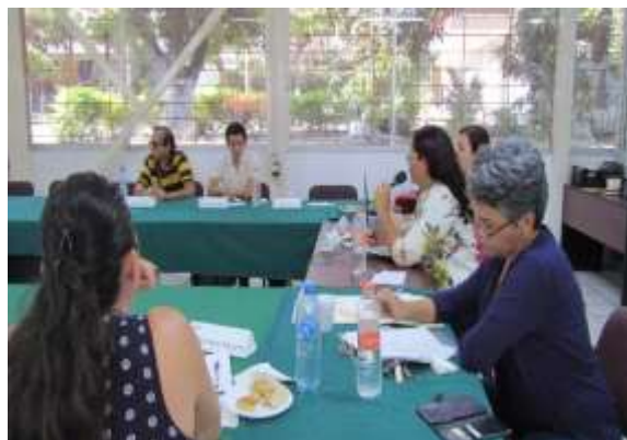
Grupo de enfoque con SE y CAE en la Junta Distrital Ejecutiva 01 en el estado de Colima

Las y los SE y CAE que participaron en los grupos de enfoque comentaron que durante la sensibilización y capacitación electoral que recibieron tuvieron algunas dudas, entre ellas las más recurrentes fueron: ¿Cómo identificar a una persona trans y cómo tratarla?, ¿Cómo identificar que en realidad la credencial es de quien la porta? y ¿Se pueden pedir pruebas adicionales de identidad?, asimismo señalaron que las mismas dudas fueron frecuentes entre las y los FMDC al momento de darles la capacitación.