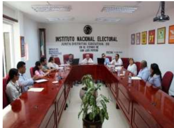
Grupo de enfoque con FMDC en la Junta Distrital Ejecutiva 03 en el estado de San Luis Potosí

Las y los FMDC que participaron en los grupos de enfoque señalaron que las principales dudas que tuvieron fueron ¿Cómo identificar a una persona trans y cómo tratarla? y ¿Cómo identificar que en realidad la credencial es de quien la porta? y ¿Qué hacer en caso de que una o un representante de partido político presente una objeción?