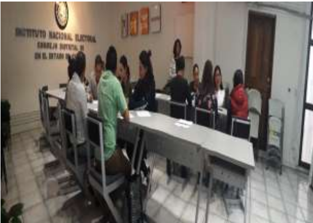
Grupo de enfoque con FMDC en la Junta Distrital Ejecutiva 08 en el estado de Chiapas