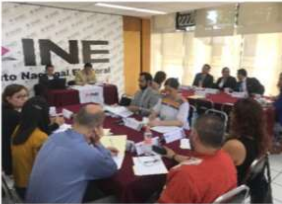
Mesa de diálogo Junta Local Ejecutiva de Aguascalientes