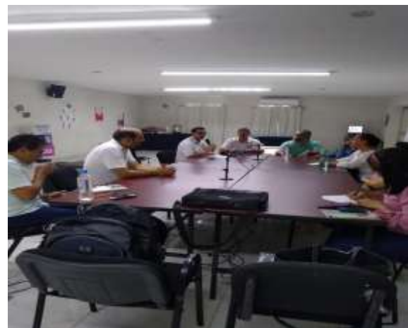
Mesa de diálogo, Junta Distrital Ejecutiva 03 de Oaxaca

Una vez que las mesas de diálogo se llevaron a cabo, las y los VCEyEC remitieron a la DECEyEC las minutas de trabajo generadas en las mismas, de las cuales es importante destacar algunos elementos, que a continuación se señalan. Sin embargo, la información detallada puede consultarse en el Anexo 2 Reporte del desarrollo de las mesas de diálogo .