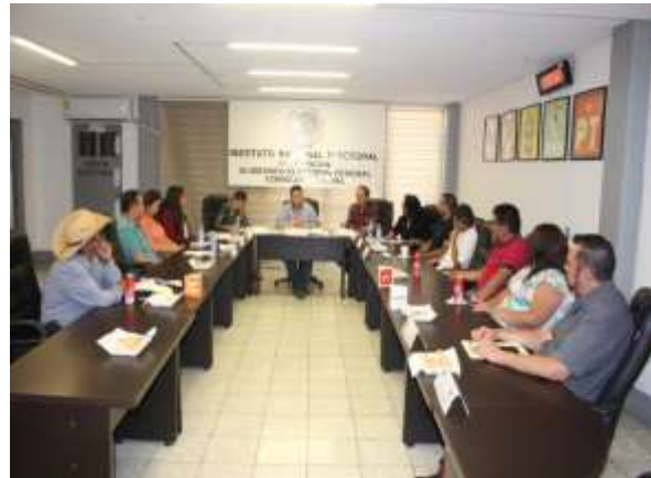
Mesa de diálogo, Junta Distrital Ejecutiva 04 de Michoacán