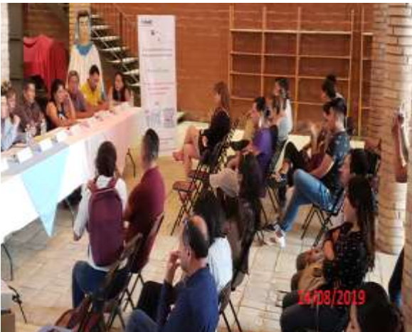
Mesa de diálogo, Junta Distrital Ejecutiva 02 de Nayarit