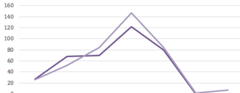
Evolución de las actividades

— Actividades planeadas — Actividades realizadas