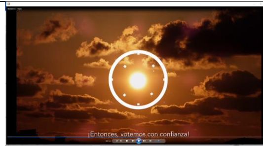
¡Entonces, votemos con confianza!