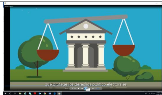
Que protege los derechos político electorales.