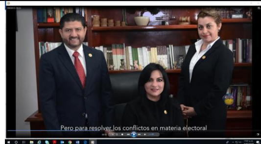
Pero para resolver los conflictos en materia electoral