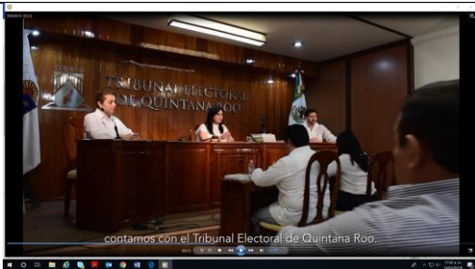
Contamos con el Tribunal Electoral de Quintana Roo