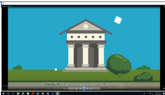
El TQROO es un órgano público, autónomo