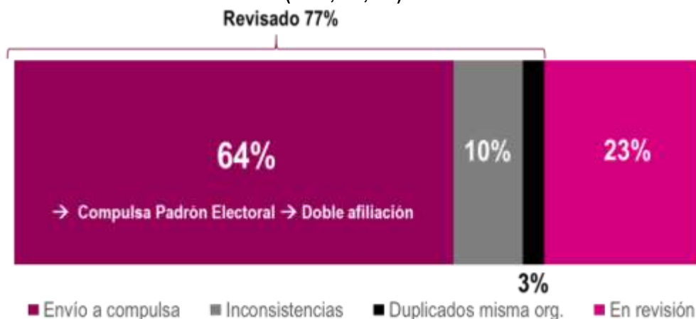
Gráfica 1. Estatus preliminar de los registros de afiliación enviados al INE (n = 1,751,937)

La totalidad de los registros de afiliaciones que remitan las organizaciones es examinada por personal de la DEPPP en la Mesa de Control conforme se estableció en el numeral 83 del Instructivo. Así, una persona revisa el expediente electrónico para asegurarse que está conformado correctamente, es decir, que las imágenes corresponden a una CPV original (anverso y reverso), fotografía de la o el afiliado y su firma autógrafa. De los más de 1.7 millones de registros, en mesa de control se han revisado 8 de cada 10 expedientes recibidos.