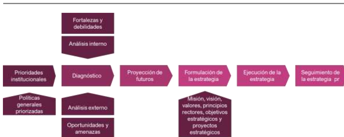
Figura 2. Proceso de diseño y formulación de la estrategia