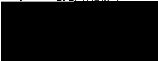
DR. LORENZO CÓRDOVA VIANELLO

EL CONSEJERO PRESIDENTE DEL CONSEJO GENERAL Y PRESIDENTE DE LA JUNTA GENERAL EJECUTIVA DEL INSTITUTO NACIONAL ELECTORAL