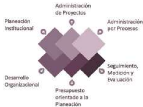
Representación gráfica del Sistema Integral de Planeación, Seguimiento y Evaluación Institucional

El sistema está conformado por seis diferentes módulos o disciplinas, las cuales están relacionadas y vinculadas entre sí.