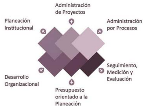
Representación gráfica del Sistema Integral de Planeación, Seguimiento y Evaluación Institucional

El sistema está conformado por seis diferentes módulos o disciplinas, las cuales están relacionadas y vinculadas entre sí.