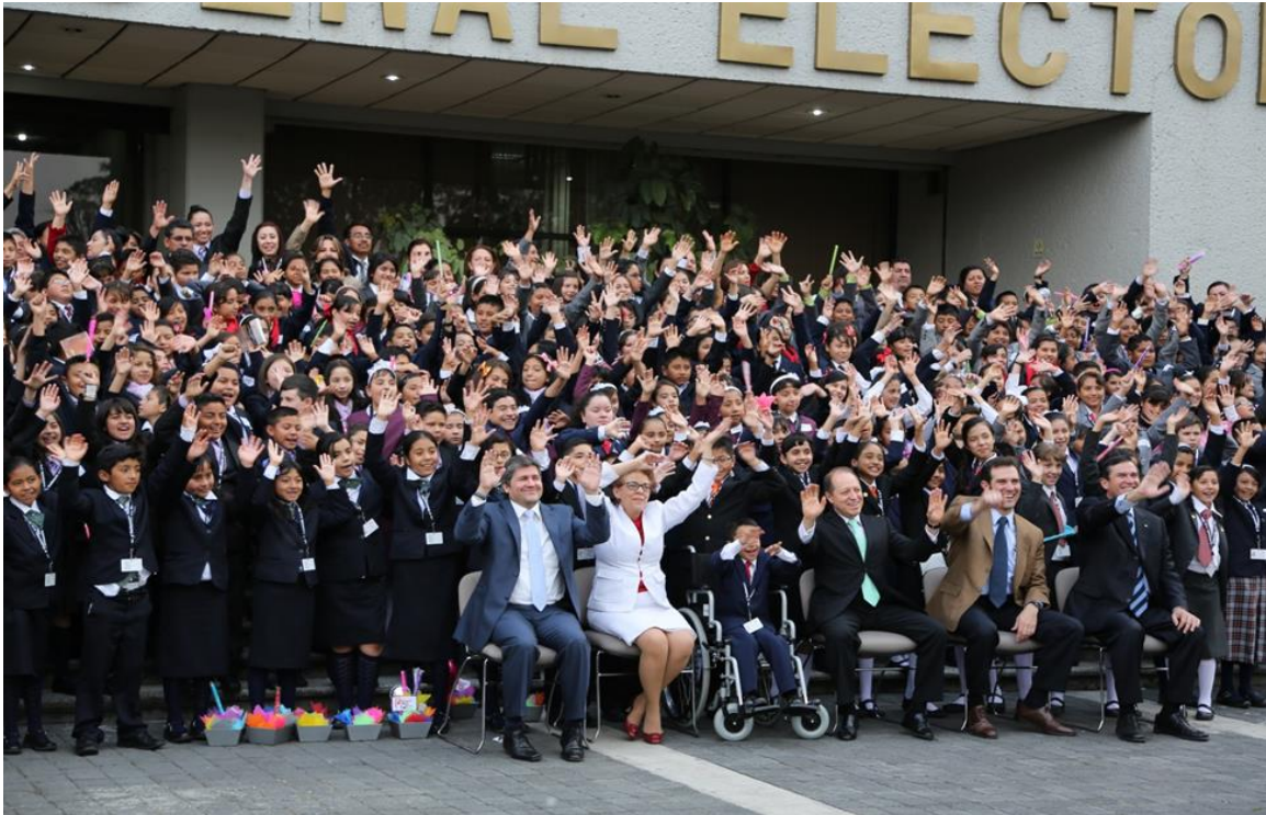
Integrantes del 9º Parlamento de las Niñas y los Niños de México con autoridades del Instituto

En la visita a estas instalaciones, se ofreció una comida de bienvenida, se llevó a cabo la toma de una fotografía oficial con autoridades del Instituto y se ofreció un espectáculo a cargo de la compañía teatral Cabaret Misterio consistente en la representación de la obra de teatro Los Vampiros Vegetarianos, cuya temática permitió que las niñas y los niños reconozcan, valoren y respeten todas las formas de diversidad; tomando en cuenta las opiniones, gustos e ideologías de los demás, fortaleciendo así, sus actitudes y valores como la tolerancia y el respeto.