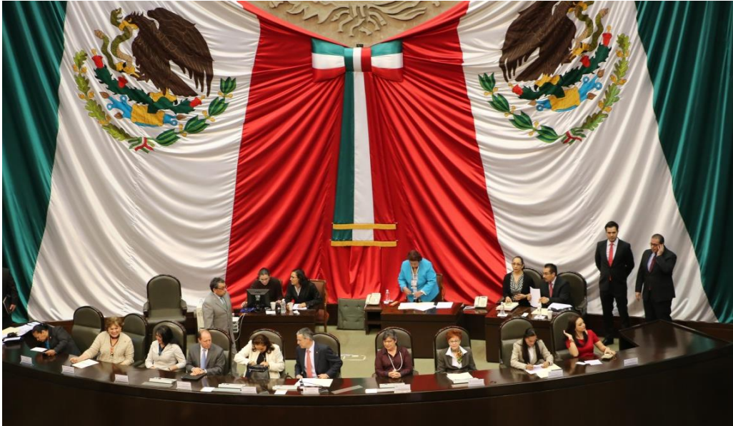
Ceremonia de Inauguración del 9º Parlamento de las Niñas y los Niños de México, en el Salón de Sesiones de la Cámara de Diputados

En esta ceremonia, mediante un proceso de insaculación, se seleccionó la Mesa Directiva del 9º Parlamento de las Niñas y Niños, la cual fue integrada de la siguiente forma: