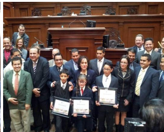
Evento de rendición de cuentas de la y los Legisladores Infantiles en el H. Congreso del estado de Aguascalientes.