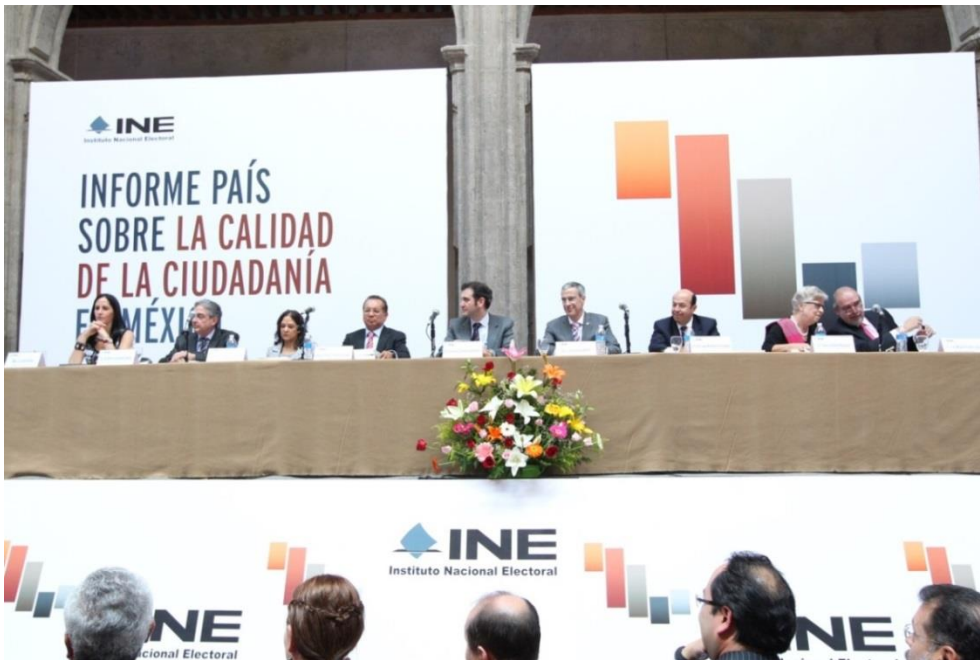
Presentación del Informe país sobre la calidad de la ciudadanía en México en el MIDE