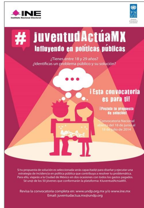
Cartel de la convocatoria #JuventudActúaMX

De los proyectos recibidos se elegirán 25, cuyos postulantes (2 por cada proyecto) serán capacitados para diseñar y ejecutar la estrategia de incidencia en política pública propuesta y así contribuir a resolver la problemática planteada.