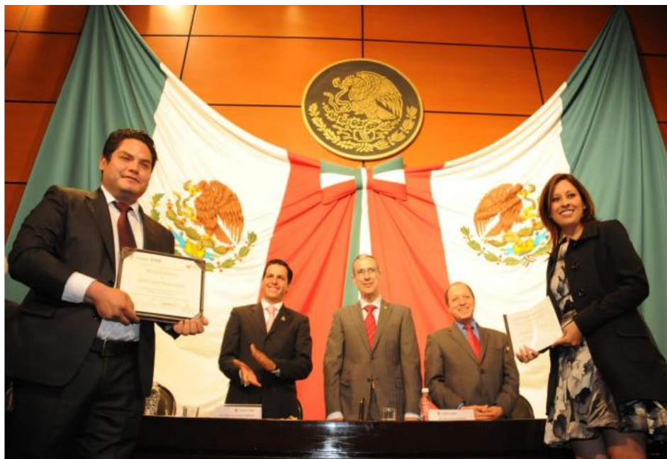
Ceremonia de premiación de Iniciativa Joven-Es por México

la importancia de generar espacios que permitan un involucramiento activo de los jóvenes en los asuntos públicos ya que con esta premisa se fortalece una ciudadanía participativa.