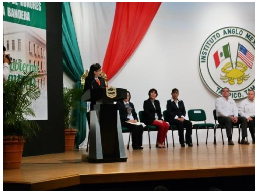
Rendición de cuentas de la Legisladora Infantil del Distrito 08 de Tamaulipas

Destaca también, la participación de 480 autoridades educativas, entre los que se encuentran representantes de las Secretarías de Educación de los niveles estatales y municipales, representantes de secciones escolares, Directores y profesorado, 228 representantes de los gobiernos Locales y Municipales. Es importante mencionar que en 41 eventos se contó con la presencia de Diputados locales o sus representantes, permitiendo con ello hacer entrega formal de la declaratoria y promover que sea considerada para atender los problemas que afectan a las niñas y niños. En 10 casos se abrieron espacios que posibilitaron la entrega de dicho documento en los Congresos Locales.