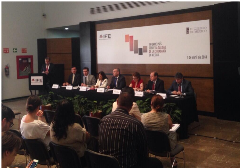
Conferencia de prensa para la presentación del Informe país sobre la calidad de la ciudadanía en México a medios de comunicación.