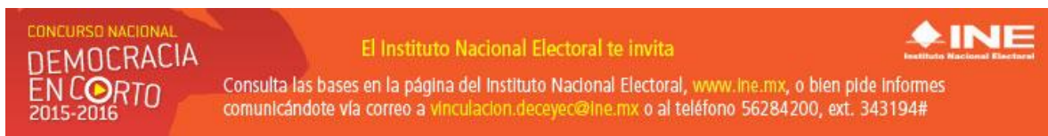
Banner utilizado para la difusión en medio electrónico

En adición a su publicación en el portal del Instituto, esta Dirección Ejecutiva ha llevado a cabo tareas de difusión de esta convocatoria entre estas: la colocación de banners promocionales en los portales de internet Cinepremier y Cuartoscuro los cuales estuvieron habilitados del 21 al 28 de diciembre de 2015.