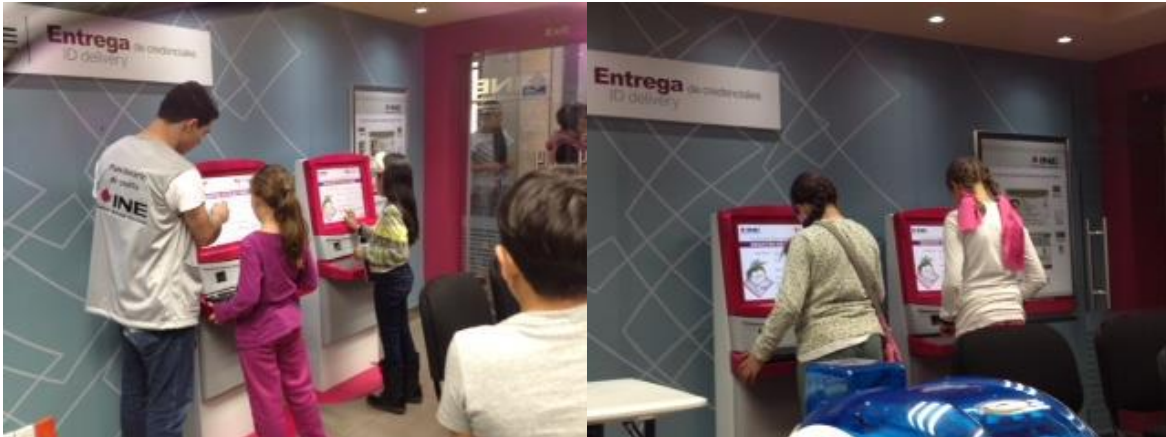
Actividades en el Módulo de Participación Ciudadana en Kidzania, Cuicuilco

Desde su apertura en enero de 2015, niñas, niños y adolescentes han tenido la oportunidad de involucrarse en una actividad basada en una metodología vivencial y el juego de roles, la cual incluye el proporcionarles una credencial que los identifica como ciudadanas o ciudadanos de Kidzania y les permite participar en un ejercicio de consulta, en el cual algunos de los visitantes tienen la oportunidad de desempeñarse como funcionarios de casilla.