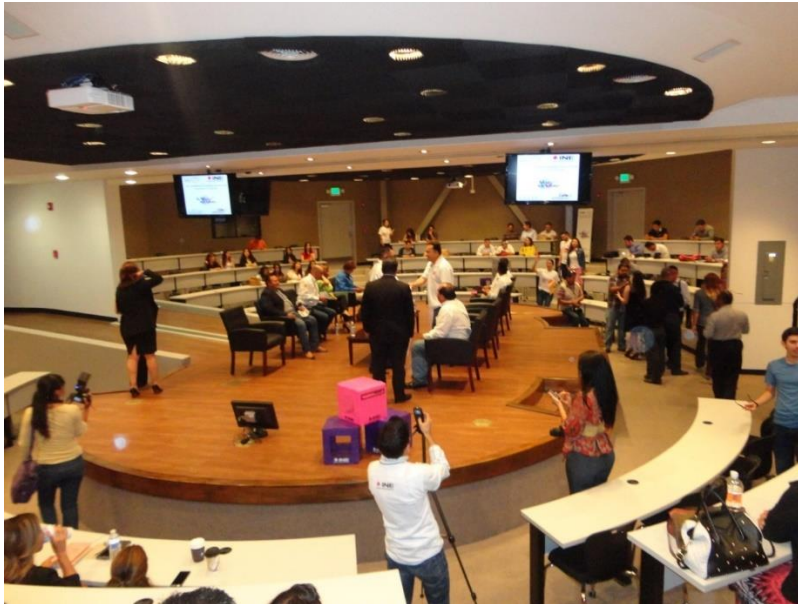
“Foro de Discusión con Partidos Políticos: Tu Voz Mi Voto” Junta Local Ejecutiva de Baja California

Con la finalidad de conocer si las personas que habían participado en las acciones de promoción de la participación realizadas por el Instituto, consideraban útil la información recibida, se realizó el levantamiento de 71,062 encuestas de opinión en las que se observa que el 94% de las y los encuestados opinaron que la pertinencia y claridad de la información o contenidos revisados en la actividad, le son útiles o muy útiles.