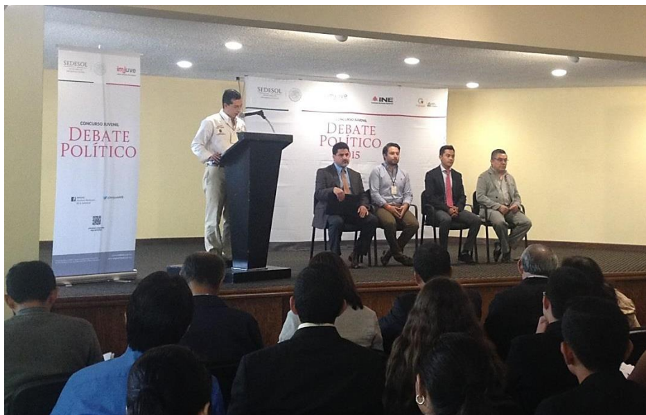
Ceremonia de Inauguración del Concurso Juvenil Debate Político 2015.

La etapa nacional del Concurso Juvenil Debate Político 2015 se llevó a cabo del 9 al 12 de noviembre de 2015, en Ixtapan de la Sal, Estado de México. El presídium de la ceremonia de inauguración estuvo integrado por autoridades de la Junta Local Ejecutiva del Instituto Nacional Electoral en el Estado de México; la Dirección de Enlace con Organizaciones Juveniles del Instituto Mexicano de la Juventud; la Dirección General del Instituto Mexiquense de la Juventud y el Instituto Electoral del Distrito Federal.