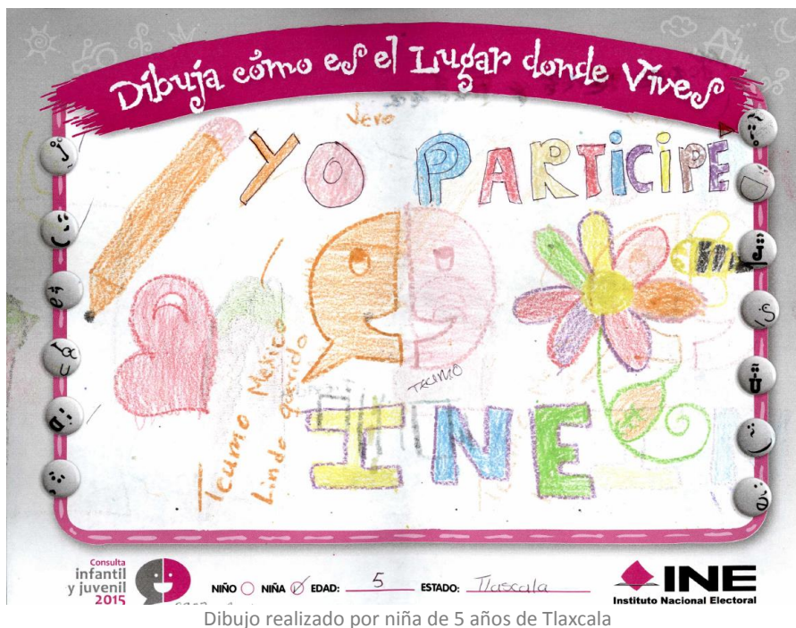
Dibujo realizado por niña de 5 años de Tlaxcala

Una vez concluido en el sistema, el registro de la información de la totalidad de las boletas, para el análisis de las frases abiertas que se incluyeron al final de las mismas, se determinó de manera aleatoria, una muestra estadística con representatividad estatal, para su captura desde las juntas distritales ejecutivas. Como resultado de esta acción, se recuperaron en el sistema un total de 34,560 frases expresadas por las niñas, niños y adolescentes participantes, que están siendo clasificadas y revisadas en un análisis cualitativo que complementará el Informe de resultados de la Consulta.