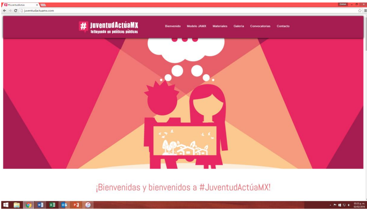
Portal de #JuventudActúaMX