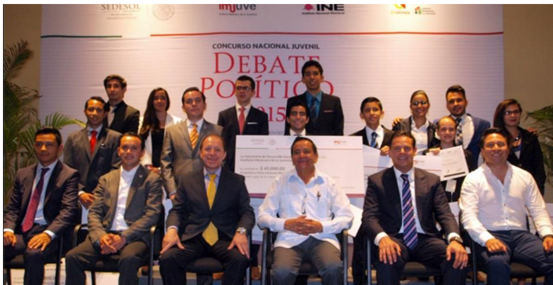
Ganadores del Concurso Juvenil Debate Político 2015 y autoridades

Estos reconocimientos y distinciones se entregaron en la Ceremonia de Premiación y Clausura del Concurso Juvenil Debate Político 2015, evento presidido por autoridades del Instituto Nacional Electoral, el Instituto Mexicano de la Juventud, la Secretaría de Desarrollo Social Estado de México y la Dirección General del Instituto Mexiquense de la Juventud.