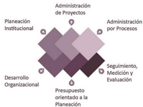
Representación gráfica del Sistema Integral de Planeación, Seguimiento y Evaluación Institucional

El sistema está conformado por seis diferentes módulos o disciplinas, las cuales están relacionadas y vinculadas entre sí.